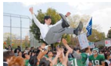
平成21年度入学式 平成21年4月7日