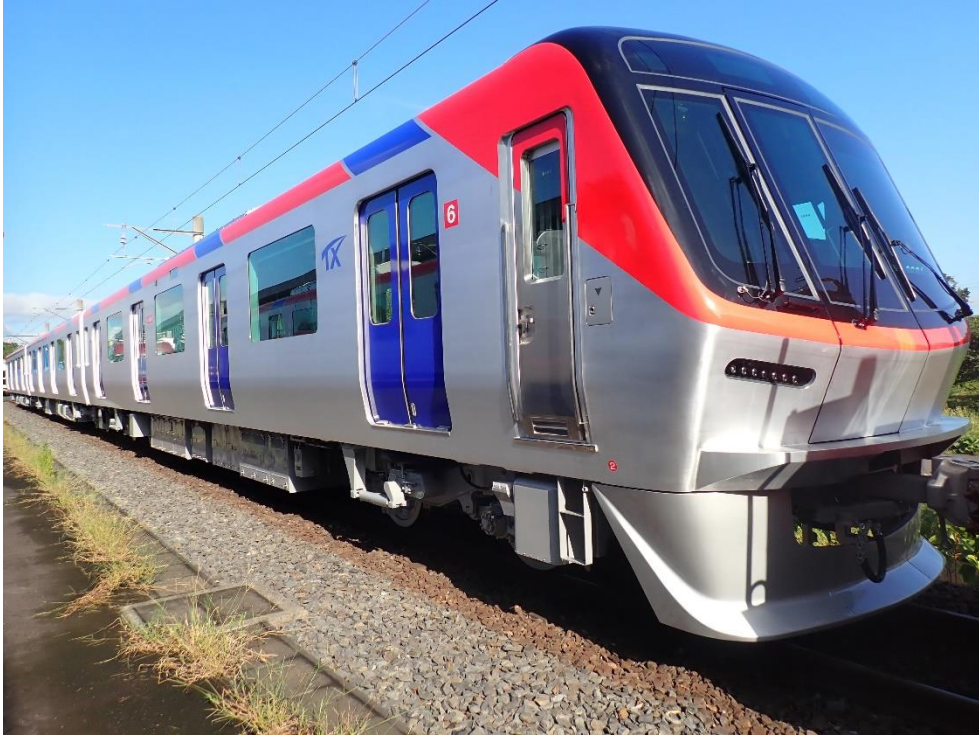
新型車両 TX-3000 系