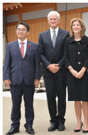
ケネディ駐日米国大使 名古屋城本丸御殿に ご案内