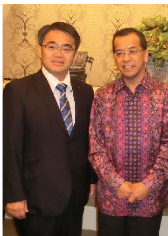
インドネシア ガルーダ 航空サタル CEO と面談