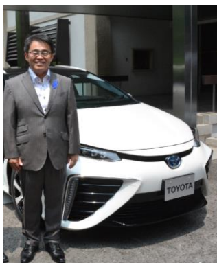
次世代自動車・燃料電池自動車（FCV）に試乗