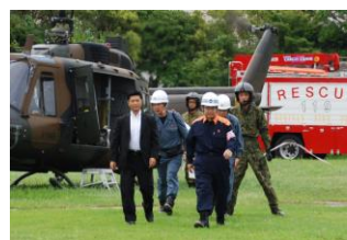
愛知県・碧南市 津波・地震防災訓練