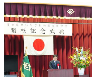
県立いなざわ特別支援学校 開校記念式典