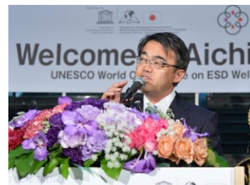
ESD ユネスコ世界会議 地元主催レセプション