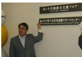
あいち子育て女性再就職 サポートセンター開設式