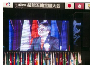
第 52 回技能五輪全国大会 閉会式