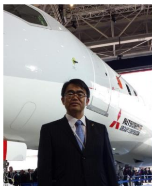
ジェット旅客機 MRJ の 県産の抹茶で茶会開催 ロールアウト式典