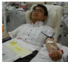
献血ルーム タワーズ 20 で献血