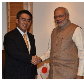
インド モディ首相と面談