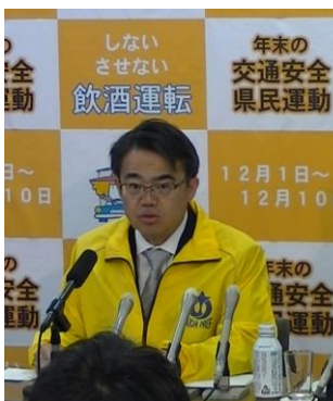
交通安全 年末緊急アピール