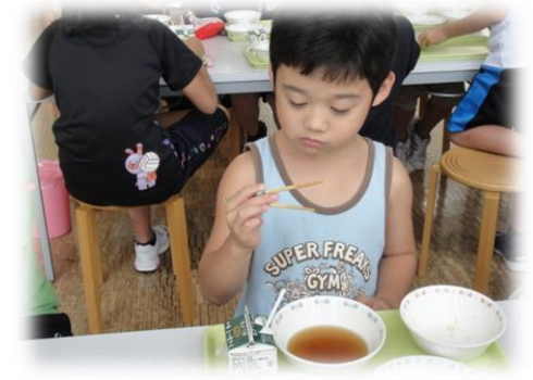
スーパー食育スクール事業指定 1年「はし名人になろう！」より