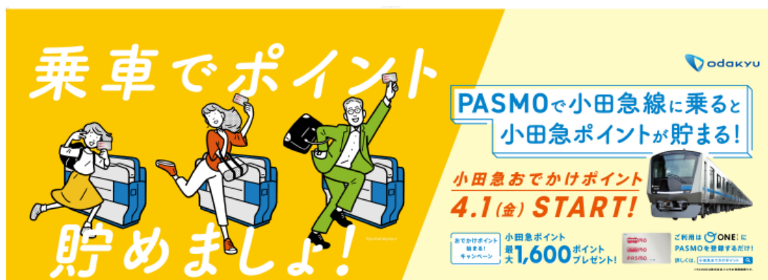
おでかけポイント始まる！キャンペーン (ポスター)