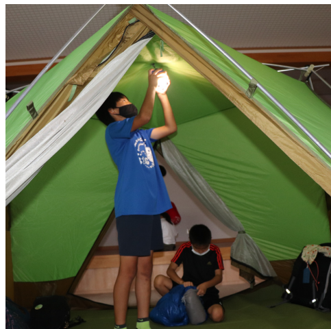
クリーンフェスティバル (宿泊体験)