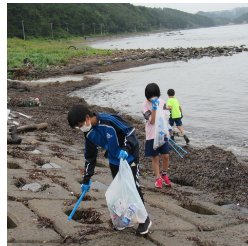
クリーンフェスティバル (清掃活動)