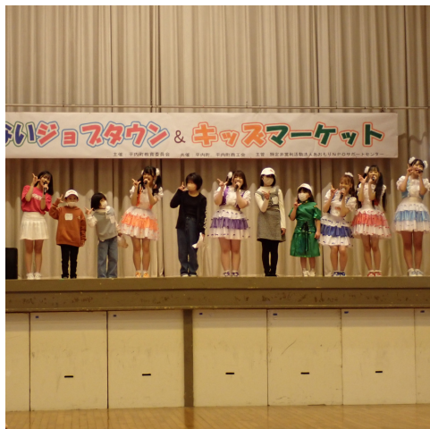
ひらないジョブタウン (アイドル)