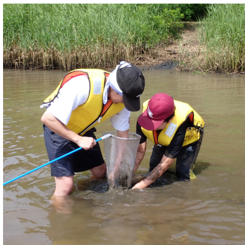
わくわく探検隊 (干潟散策)