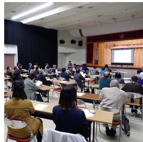
ひらないカレッジ (ふるさと歴史講座)