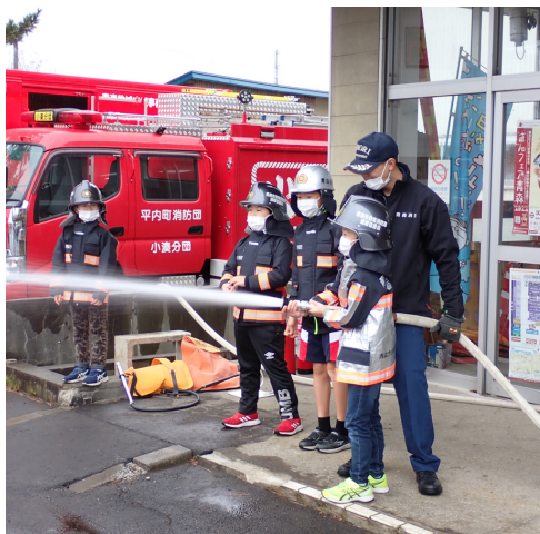
ひらないジョブタウン (消防士)