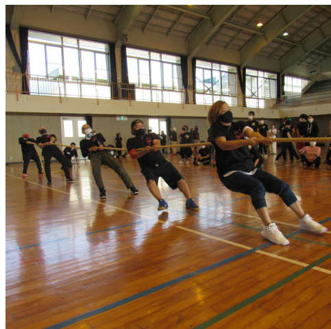
平内町スポーツ推進委員協議会 会長杯争奪平内綱引き大会