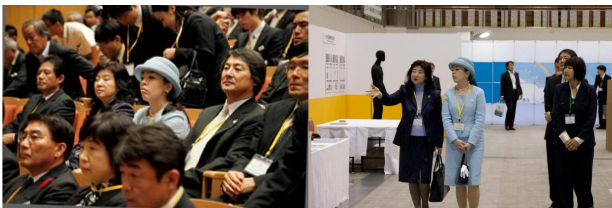
第 4 回国際 UD 会議 2012 in 福岡の公開シンポジウムと展示会をご鑑賞なさる瑤子女王殿下

また、11 月 21 日 (木) に開催される「IAUD 設立 10 周年記念イベント」にもご臨席いただき、おことばを頂戴する予定です。