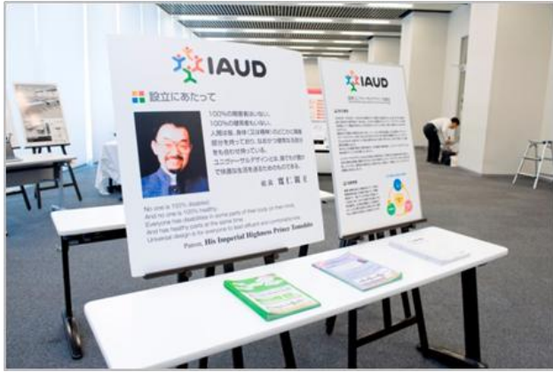
皇太子殿下もご覧になられた故寛仁親王殿下のIAUD 設立時のおことば「100%の障害者はいない。100%の健常者もいない。」