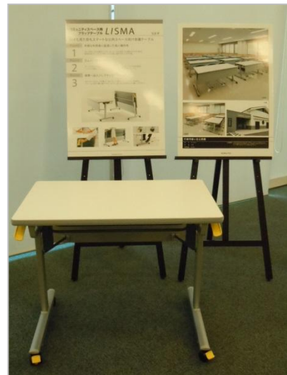
コクヨファニチャー(株)