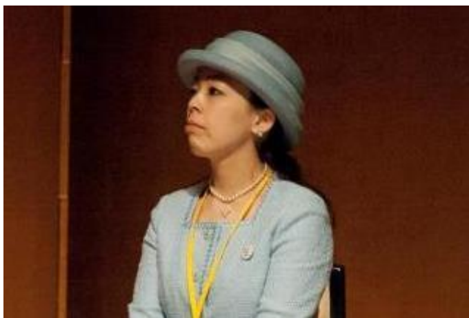
第 4 回国際 UD 会議 2012 in 福岡の開会式にご臨席

故寛仁親王殿下のご次女で日頃から社会福祉にご関心のある瑤子女王殿下が、8 月 29 日 (木) 付で正式に IAUD 新総裁にご就任されました。