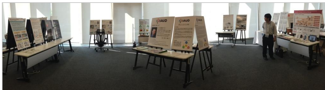
会員企業 7 社が参加した IAUD ブース

IAUD ブースには会員企業の日本電気(株) (NEC)、(株)リコー、(株)岡村製作所、積水ハウス(株)、コクヨファニチャー(株)、(株)モリサワ、富士通(株)が出展参加し、それぞれ UD の取り組みを紹介したパネルや UD 製品を展示しました。