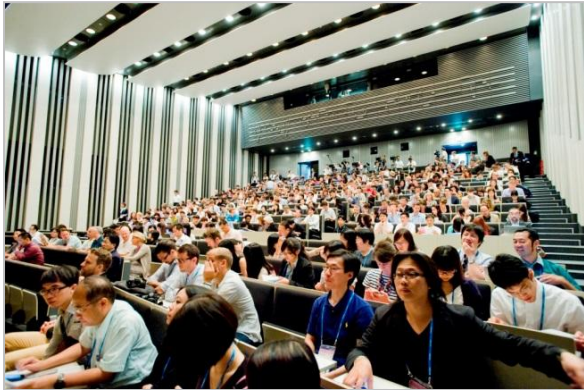
満員となった開会式会場

IASDR2013 のメインテーマは「デザインにおける知の統合と革新」。会議は論文発表やテーマに基づく基調講演とシンポジウム、デザインにおける博士教育のワークショップや展示会など、多様なプログラムが行われ、5 日間の開催中、41 の国・地域から研究者や教育者、デザイナーなど約 700 人が出席し、世界のデザイン研究の相互理解がなされました。