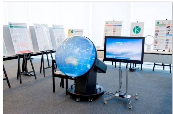
キッズデザイン協議会