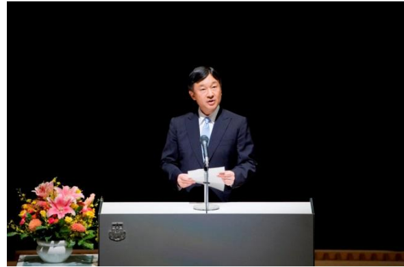
開会式でおことばを述べられる皇太子殿下

27 日に行われた開会式には皇太子殿下がご臨席され、「リサイクルしやすい製品のデザインや、文化、言語、年齢、性別、障害や能力の如何(いかん)を問わず、全ての人にとって使いやすく快適な施設、製品、情報のデザインが増えていくことなどを通じ、多様な人々の生活の質の向上に皆さんが尽力しておられることに深く敬意を表します。(中略)世界が環境問題や高齢社会などの複合的な課題を新たなサービスの創出と質の向上などを通じて克服していくために、デザイン学の役割は今後より重要となります(日本語訳:主催者)」と、英語でおことばを述べられました。