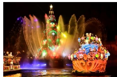
「カラー・オブ・クリスマス」

ミッキーマウスをはじめとするディズニーの仲間たちは、クリスマスのオーナメントが輝く船に乗って登場し、夜のメディテレーニアンハーバーを一層ロマンティックに彩ります。