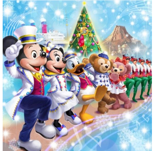
東京ディズニーシー 「ディズニー・クリスマス」

また、アメリカンウォーターフロントの豪華客船S.S.コロンビア号の前には高さ約15メートルの巨大なツリーが設置され35周年のロゴが加わるほか、ロストリバーデルタではデコレーションとイルミネーションが新たに展開され、どこよりもカラフルで陽気なクリスマスをお楽しみいただけます。そのほかにも、テーマポートごとにバラエティに富んだイルミネーションきらめくクリスマスの世界がゲストの皆さまをお迎えします。