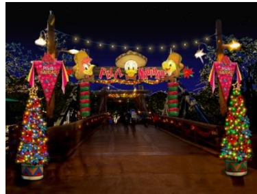
ロストリバーデルタのデコレーション