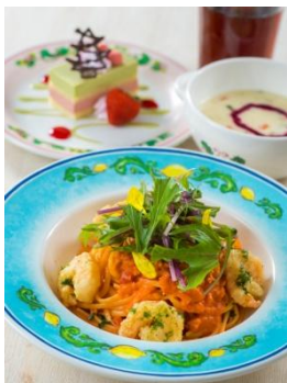
カフェ・ポルトフィーノ スペシャルセット 1,880円