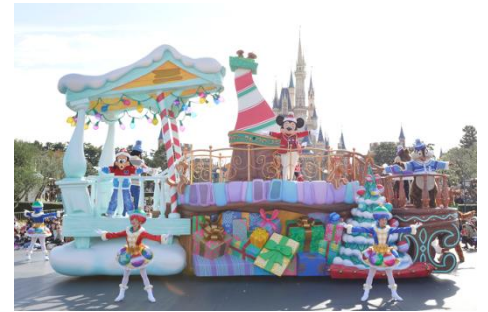
「ディズニー・クリスマス・ストーリーズ」

途中、2カ所でパレードが停止すると、鐘の音が鳴り響き、クリスマスパーティーが始まります。ディズニーの仲間たちが奏でる鈴の音とともに、ゲストは手をたたいてパレードに参加し、徐々にテンポが上がるクリスマスソングに合わせて、盛り上がりは最高潮に達します。フィナーレではパレードルートに雪が舞い降り、ゲストとディズニーの仲間たちが一緒に心あたたまるクリスマスをお祝いします。