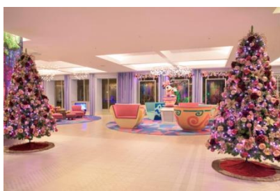
東京ディズニーセレブレーションホテル： ウィッシュのデコレーション