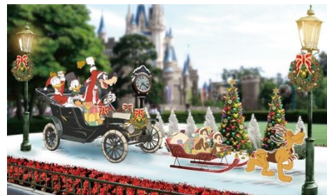
シンデレラ城前のプラザのフォトロケーション