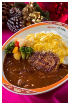
ハングリーベア・レストラン ハンバーグ&エッグのハッシュドビーフ(ラージサイズ) 1,280円