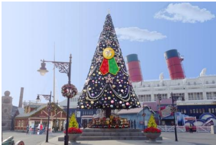
アメリカンウォーターフロントのクリスマスツリー

ロストリバーデルタでは、クリスマスのデコレーションとイルミネーションを、今年はさらに華やかさと輝きを増して展開します。テーマは、ドナルドダック、ホセ・キャリオカ、パンチートと住人たちが、訪れるゲストにクリスマスを楽しんでもらおうと準備した、どこよりもカラフルで賑やかなクリスマスの飾り付けとイルミネーション。陽気で楽しいクリスマスの世界がゲストをお出迎えします。