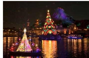
「カラー・オブ・クリスマス-アフターグロー」

きらびやかな雰囲気に含まれているメディテレーニアンハーバーでは、人々の願いが集まり光り輝くクリスマスツリーと小さなツリーのオブジェが、花火が終わった後もクリスマスの音楽にあわせて色とりどりに輝き続けます。今年も、一部の公演では雪が舞い、ロマンティックな雰囲気をお楽しみいただけます。