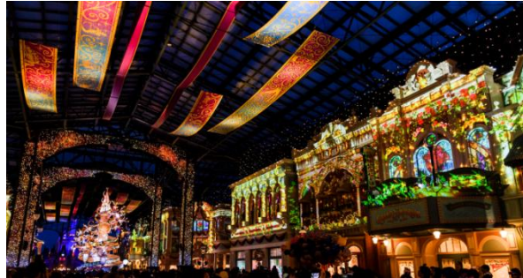
「セレブレーションストリート」

「東京ディズニーリゾート 35 周年 “Happiest Celebration!”」の開催期間中、多くのゲストを魅了しているワールドバザールの「セレブレーションストリート」は、夜の演出で期間限定のクリスマスバージョンを実施します。音楽と光に包まれる特別なクリスマスの演出にどうぞご期待ください。