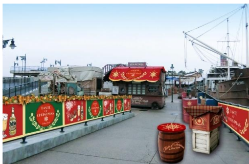
「テイスト・オブ・クリスマス」のデコレーション

ゲストの皆さまは、あたたかなクリスマスのムードの中、まるでニューヨークの住人になった気分で、大人の贅沢な時間をお過ごしいただけます。