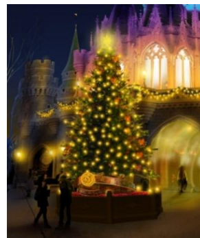
シンデレラ城の裏のクリスマスツリー