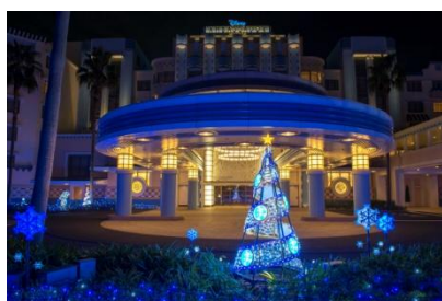
ディズニーアンバサダーホテルの イルミネーション

また、レストランとラウンジでは、パークのスペシャルイベントの雰囲気があふれる華やかなメニューを提供します。ディズニーアンバサダーホテルと東京ディズニーランドホテルでは、ディズニーの仲間たちが繰り広げる楽しいクリスマスの世界観を感じられるお料理をご用意します。東京ディズニーシー・ホテルミラコスタでは、1年で最も輝かしい季節であるクリスマスにふさわしい、華やかなコース料理やブッフェをお楽しみいただけます。