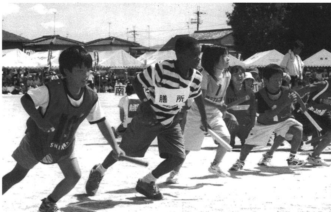
▲小学生リレー/第一走者