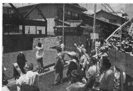
大津で暴力団排除に結束

大津市内では住民による暴力団追放運動により、2カ所の組事務所が事務所を開けず撤退し住民パワーの団結力が住みよいまちづくりに、大いに貢献し成果を収めつつある。