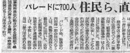
パレードに700人 住民ら、直談判も

大津市中央区の暴力団事務所進出に住民らが反対し、事務所進出を許さないという決意を表明した。住民らは、暴力団事務所が地域の治安を脅かすだけでなく、子どもや高齢者の安全を脅かすとしている。また、暴力団事務所が地域の経済活動を阻害していることも指摘している。