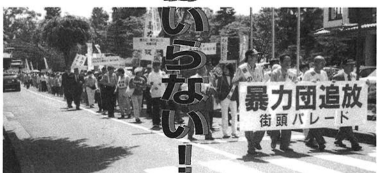
朝日新聞6月13日号/記事