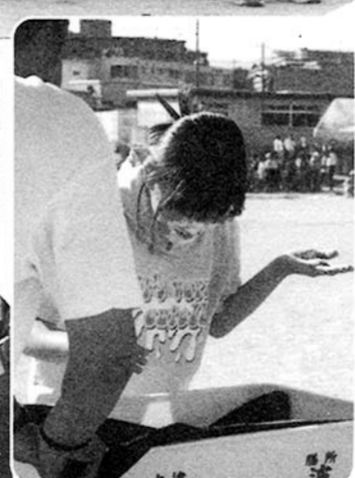
▲ラケット競走 来賓及び60歳以上