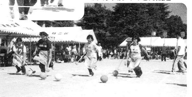
▼自治会アベック点拾い競走