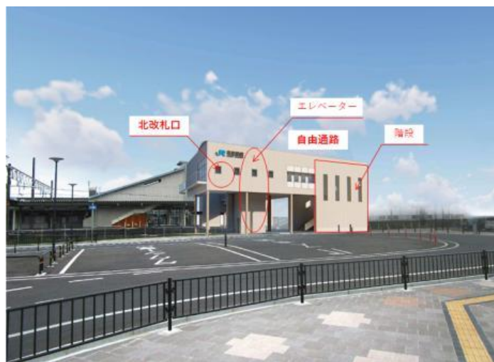
完成イメージ（北側から）