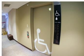
多機能トイレ (ドア)