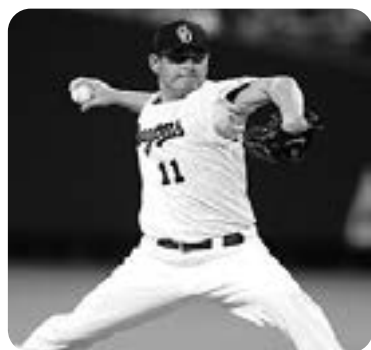
講師 元中日ドラゴンズ投手 川上憲伸さん

阿智中学校PTAは元中日ドラゴンズ投手川上憲伸さんをお招きし、お話を聞きます。貴重な機会ですので多くの皆さんに足を運んでいただきたくお知らせします。