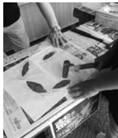
薬草研究会で薬草お楽しみ会をしま した 健康の森へようこそ！

自分の活動の根底には「命」というものがあるのだと感じています。 「小さいモノ、弱いモノが幸せでない世界は、私たちにとっても幸せな 世界ではない。この世界に生きているのは自分たちだけではない。」当 たり前なのに当たり前になっていない事。これからも試行錯誤しなが ら行動していきたいと思えます。是非みなさんの力を貸してください ★残り1年半よろしくお願ひします！