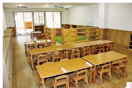
(落成式) 1_テープカットをする関係者の皆さん/ 2_あいさつを述べる琴田理事長 (内覧会) 3_5歳児保育室/ 4_クライミングウォール/ 5_お昼寝用ベッド