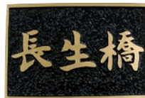
長久保 育男 (小野中1年)