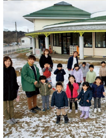
(小野わかば幼稚園) 1_卒園式/ 2_閉園のセレモニー/ 3_小野わかば幼稚園の皆さん/(中央さくら保育園) 4_卒園式/ 5_閉園のセレモニー/ 6_中央さくら保育園の皆さん/(夏井おおすぎ保育園) 7_卒園式/ 8_閉園のセレモニー/ 9_夏井おおすぎ保育園の皆さん/(飯豊ひまわり保育園) 10_卒園式/ 11_閉園のセレモニー/ 12_飯豊ひまわり保育園の皆さん

町営の幼児教育施設は閉園となりますが、在園児のほとんどがおのまち認定こども園に通うこととなります。町は今後も、小野小学校、小野中学校と連携を図りながら、幼児教育・保育の充実に努めていきます。