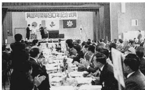
開基90年記念式典風景（昭和53年）