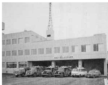
紋別地区消防組合興部支署（昭和49年当時）