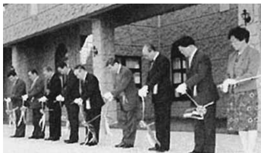
「オホーツク農業科学研究センター」落成式