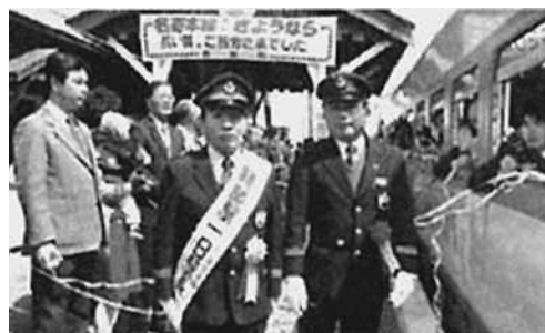
J R 名寄線お別れ式