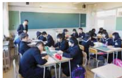
理科では、「仮説の検証」に取り組んでもらいました