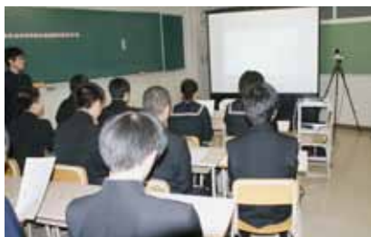
遠隔授業では、お互いの様子ははっきりと映し出されます

興部高校の魅力を知っていただくためにも、ぜひ、ご参加下さい。(下の写真は昨年度の様子です)