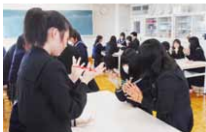
在校生と一緒に活動した日常的な伝承遊び(家庭科)