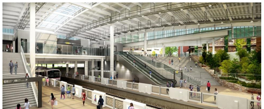
新くなる「南町田グランベリーパーク駅」イメージ