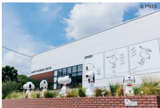
六本木のスヌーピーミュージアム外観