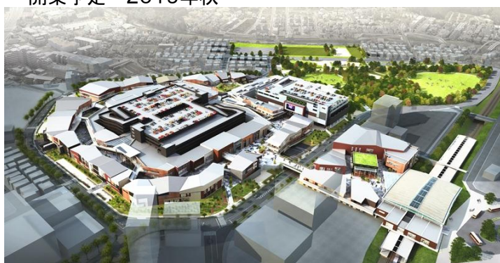
「南町田グランベリーパーク」俯瞰イメージ