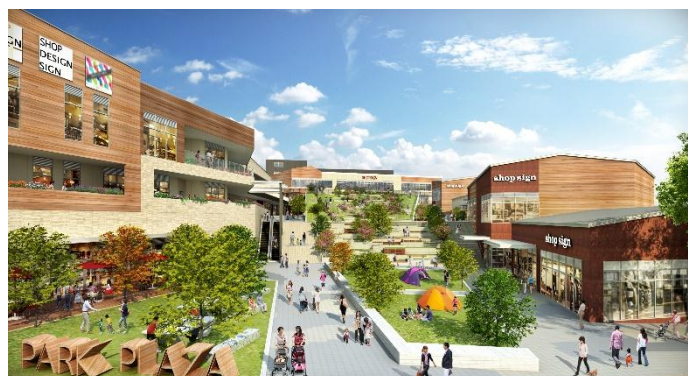
商業施設「グランベリーパーク」内 広場イメージ