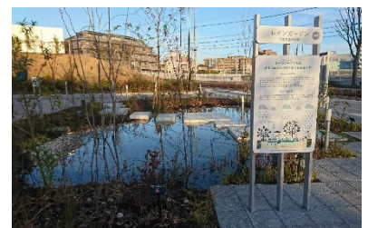
▲雨のにわ:レインガーデン

【国土交通省による記者発表(2020年12月17日 「第1回グリーンインフラ大賞の優秀賞を決定しました!」)】