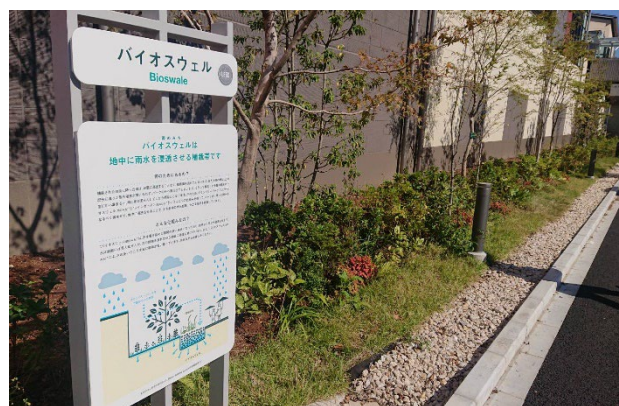
▲雨のみち：バイオスウェル

本プロジェクトは、田園都市線「南町田グランベリーパーク駅」（2019年10月1日に「南町田駅」から改称）南側に広がる鶴間公園と2017年2月に閉館したグランベリーモール跡地を中心とする約22haのエリアについて、官民が連携し、都市基盤・商業施設・都市公園・駅などを一体的に再整備・再構築し「新しい暮らしの拠点」の創出に取り組むまちづくりプロジェクトです。