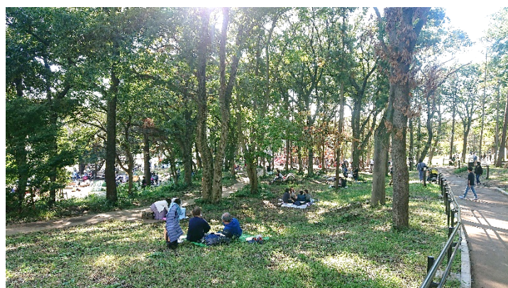
▲多様な活動が営まれる鶴間公園