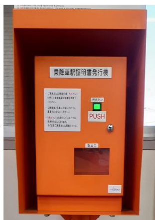
乗降車駅証明書発行機

なお、館林駅・太田駅・栃木駅の各乗換駅では、ホームに設置してある特急券券売機で特急券をお買い求めできますのでご利用ください。