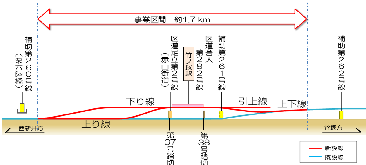
△東武伊勢崎線（竹ノ塚駅付近）連続立体交差事業（完成イメージ）