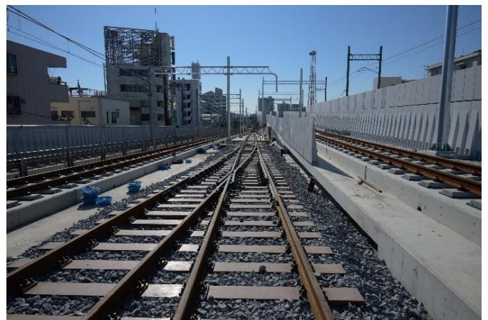
△竹ノ塚駅付近高架橋（左：駅ホーム部分 右：高架区間）