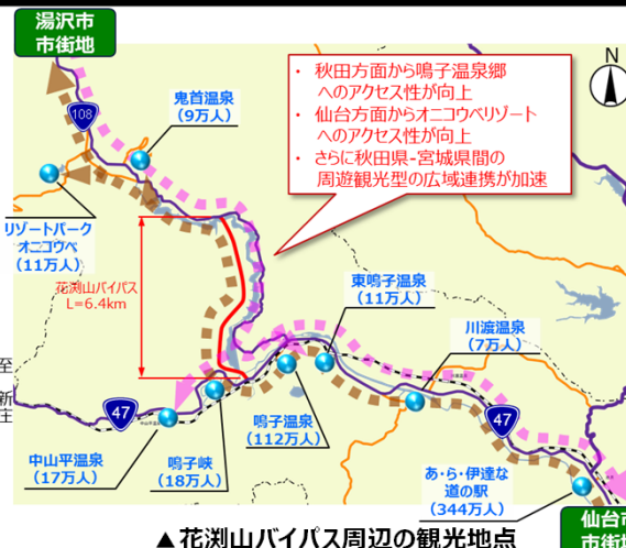
▲花瀧山バイパス周辺の観光地点