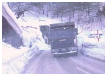
②現道における狭隘区間(冬期)