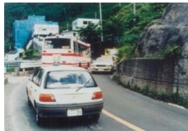
①現道における線形不良箇所