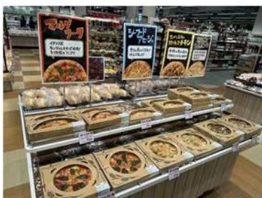
店内の専用窯で焼き上げた本格的なピッツァ