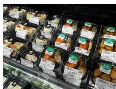
店内で燻製にしたお魚をカット チーズ売場で品揃え