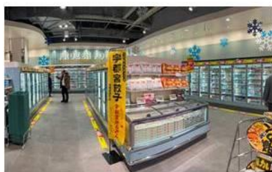
当社最大級の冷凍食品売場