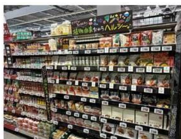
プラントベースの商品を コーナー化