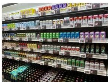
選ぶのが楽しくなるクラフト ビールや輸入ビール

クラフトビール、輸入ビール、およびビール風のノンアルコールビールを多彩に揃え、さらにそれに合うおつまみも販売いたします。お客様に選ぶ楽しさを提供するため、バラエティ豊富にご用意しております。また、女性や若い方向けには、甘いお酒や低アルコール度数の商品、見た目にも美しい商品を手軽にお試しいただけるよう、小容量の商品も充実させております。