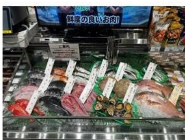
鮮度の良いお魚を提供します

地域の皆様から寄せられる「子供に食べさせたいと思えるお魚が近くで買えない」という声にお応えするため、鮮魚の品揃えを充実させ、築地に行かなくても晴海で魚を買いたいと思っただけの品揃えを行います。また、「まぐろ解体ショー」などの魚の楽しいイベントも定期的で開催していきます。