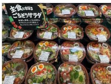
青果売場サラダコーナーの サラダボウルやパスタサラダ

店内で手作りしたフレッシュサラダやカットフルーツ、さらには焼魚や煮魚、お肉総菜など、サミット自慢の品を豊富に取り揃えています。また、これらを使用したお弁当もご用意し、お仕事や家事、育児にお忙しい方の「簡単に美味しく食べたい」というご要望にお応えできる売場となっています。