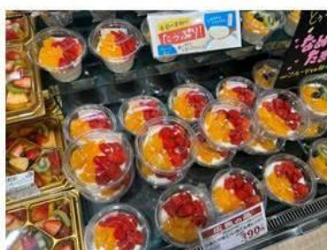
カットフルーツを盛り込んだ 店内製造のスイーツ