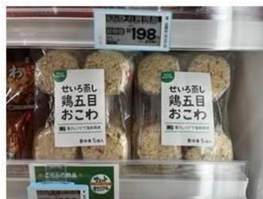
サミットオリジナルの美味しい冷凍食品