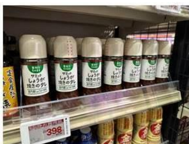
添加物を極力使わずやさしい 味わいの「しょうが焼きのタレ」