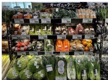
オーガニックの野菜をまとめて販売

店舗周辺には健康への意識が高い方が多くいらっしゃることから、余計な添加物を使用しない商品やオーガニック商品を豊富に品揃え、ご要望に応えたいします。