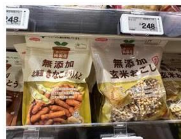
「ノースカラズ」の無添加の お菓子も品揃え