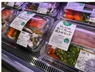
新鮮な素材を使用し店内で製造したミールキット

調理の手間を省き、お仕事や育児で忙しい方々が時間を節約できるよう、フライパンで焼くだけや電子レンジで温めるだけで食べられる簡便・半調理品の品揃えを充実させています。