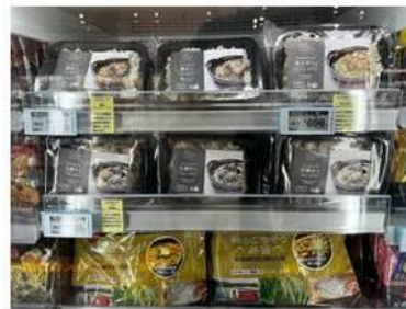
ワンプレートで昼食に便利な冷凍食品