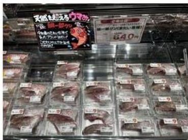
宇和島のきれいな海で育った まだい「鯛一郎くん」