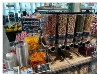
青果売場にはおつまみにも 最適なナッツ類のバイキングも