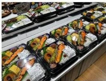
店内製造の焼魚や煮魚を使用したお弁当