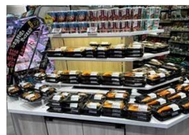
焼魚や煮魚も豊富に品揃え