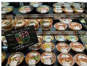
レンジで温めるだけで簡単に食べられるスープ