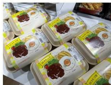
お昼ごはんにもちょうど良い「ロコモコ」や「海鮮ユッケ丼」も