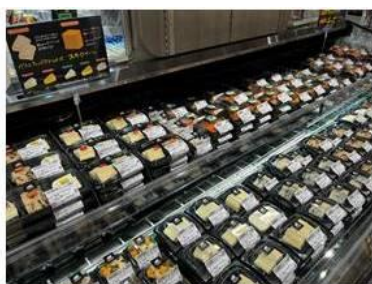
種類豊富な店内カットチーズ