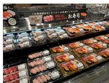
新鮮なネタを使用したお寿司