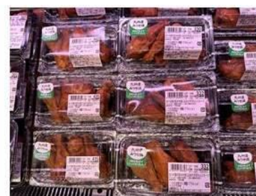
おつまみにも合う 店内で燻製にしたお肉