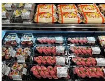
精肉売場のローストビーフを使用したにぎり寿司