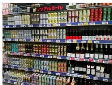
ノンアルコール飲料も豊富に 品揃え