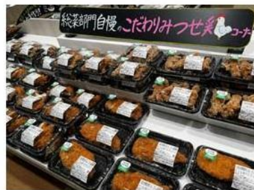
精肉売場でも販売する「みつせ 鶏」を使用したお惣菜