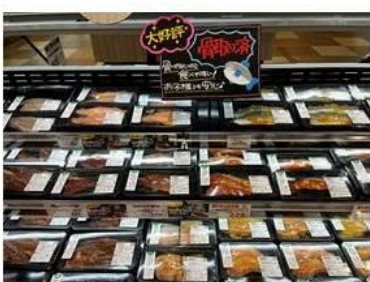
骨取り済みなのでお子様にも安心