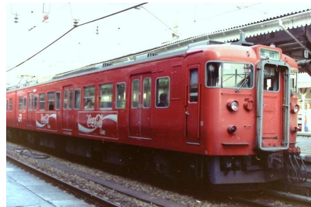
▲かつて運行していた「コカ・コーラ」レッドカラーの電車

有効な軽井沢駅の入場券又は軽井沢駅発着の乗車券をお持ちの方であれば、どなたでもご参加いただけます。