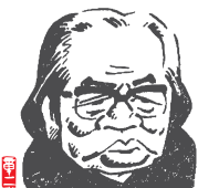
イラスト:山藤 章二