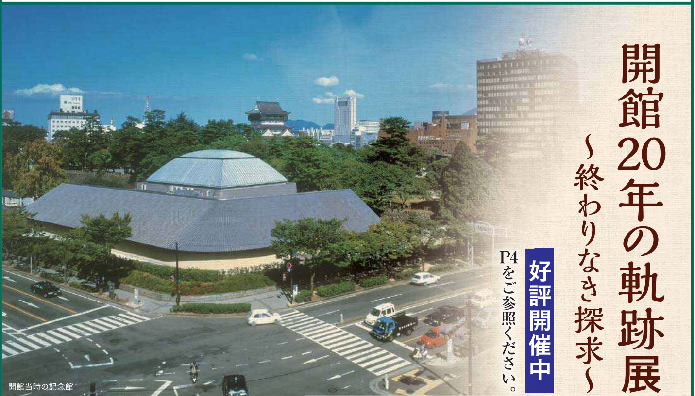
開館当時の記念館