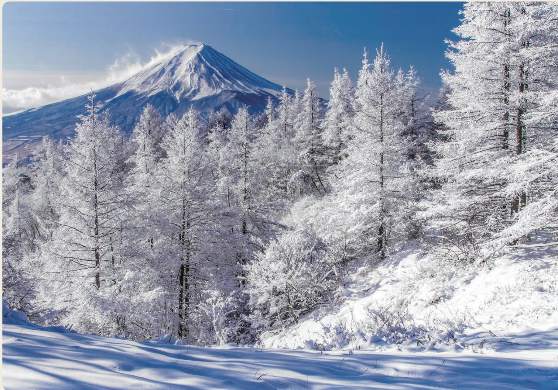
写真 第1回わたしの美しい森フォトコンテスト 関東森林管理局長賞 富士を臨む樹氷の森 早水 健一