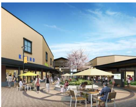
「ヒルサイド」イメージ

また、飲食店舗を集めたフードエリアを中心に、飲食や食物販の店舗を拡充。マカロン・パリジャンを生み出した老舗パティスリーメゾン「ラデュレ」や、静岡県のソウルフード「炭焼きレストランさわやか」、箱根強羅名物“豆腐かつ煮”が人気の「田むら銀かつ亭」などがアウトレット施設日本初出店。幻のコシヒカリ『雪ほたか』を美味しく味わえる食堂スタイルの新業態レストラン「サロン ギンザ サボウ こめ食堂」、トランジットジェネラルオフィスが手がけ、脇屋友詞氏が監修する点心や汁なし担々麺を提供する新業態「ファンファン飲茶」もお目見えいたします。