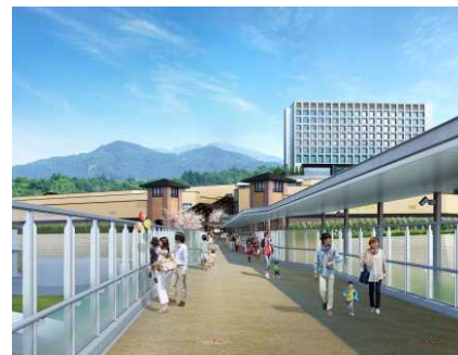
新設の橋からみた「ヒルサイド」イメージ