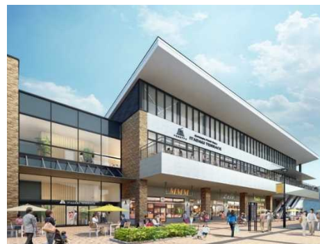
「いただきテラス」外観イメージ