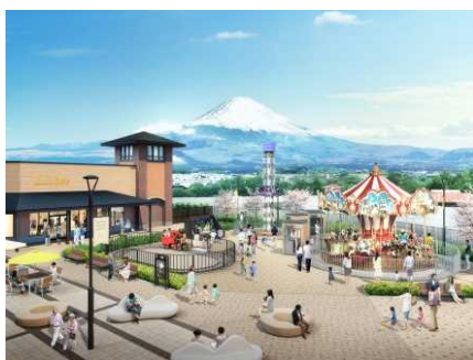
「ヒルサイド」エリアイメージ