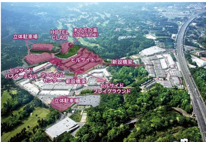
第 4 期増設後 鳥瞰図 イメージ

国内外のお客様に“新たなアウトレットの楽しみ方”を提案しようと、「ヒルサイド」の開業に先駆け、昨年 12 月 15 日には小田急グループの「HOTEL CLAD」と日帰り温泉施設「木の花の湯」が開業しました。