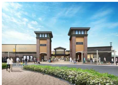
「ヒルサイド」エントランスイメージ

御殿場プレミアム・アウトレットは、アメリカ生まれのアウトレットとして日本に開業して今年で20年。アウトレットの枠を超え“日本を代表する唯一無二のショッピングリゾート”へとアップグレードし、エリアの広域観光拠点となる施設を目指します。