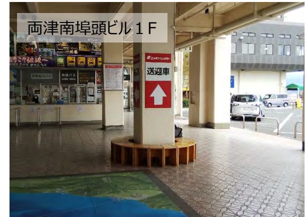
両津南埠頭ビル⇔レンタカー

フェリーターミナルに隣接する必要があるが、現敷地内での建て替えは不可能。 ⇒ フェリーターミナルの隣接地に両津南埠頭ビルの建替え用地が必要