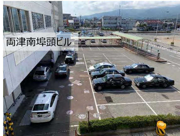
両津南埠頭ビル⇔タクシー、レンタカー