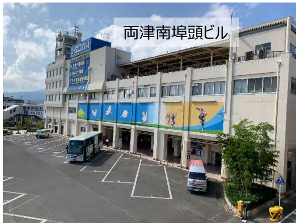
両津南埠頭ビル⇔バス