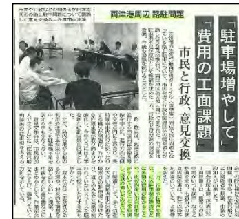
2019.9.4 新潟日報記事 「両津港周辺 路駐意見交換会」

近年、両津港周辺の駐車場について市民の関心が高まりつつある ⇒現状の交通需要を踏まえた埠頭利用の見直しが必要