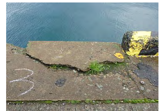
上部工の損傷状況