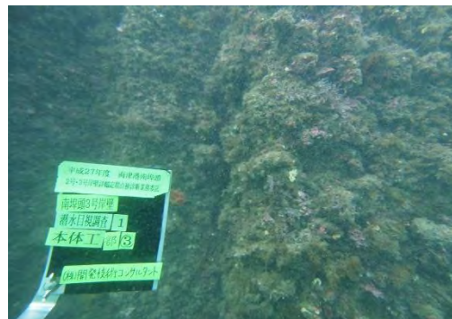
本體工（鋼矢板）の損傷状況