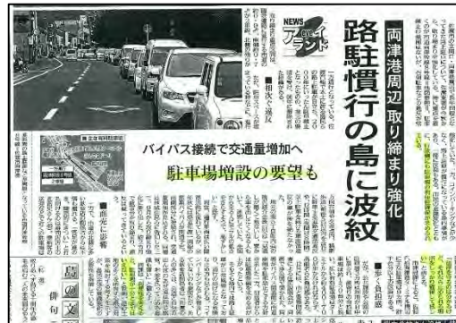
2018.12.15 新潟日報記事 「両津港周辺 路駐取り締まり強化」