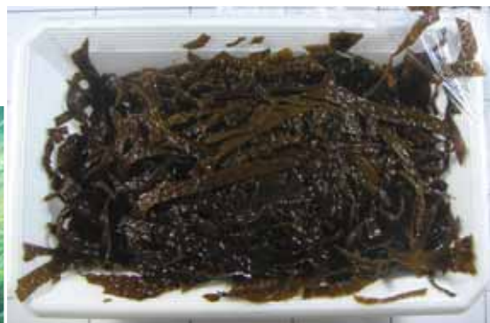
下ゆでしたツルアラメ