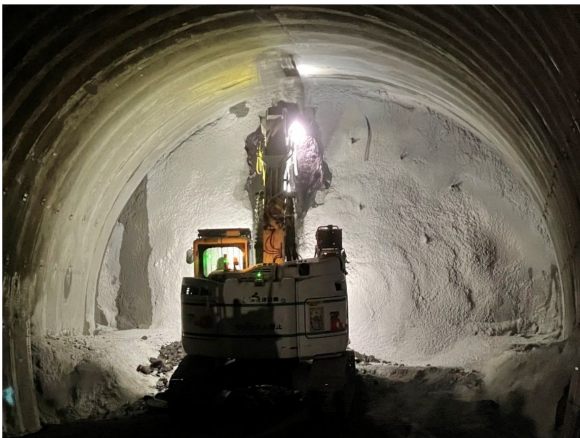
トンネル貫通時の様子(令和5年3月13日)