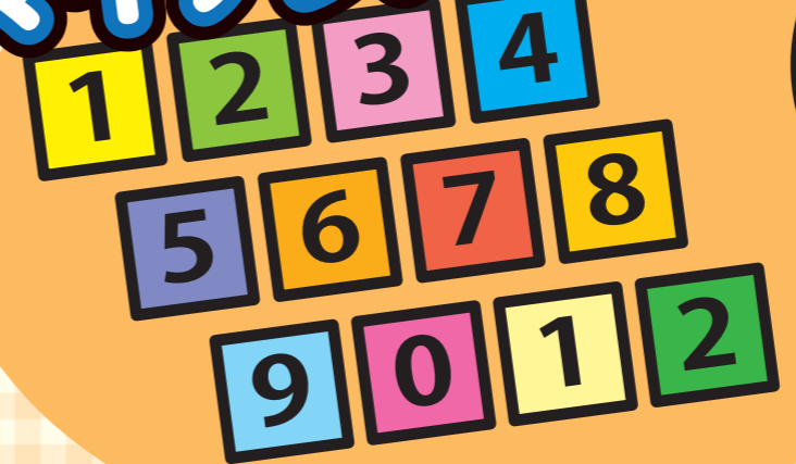
マイナンバー PRキャラクター マイナちゃん