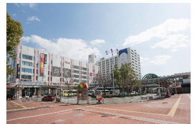
塚口さんさんタウン