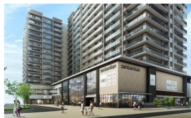
プライド阪急塚口駅前