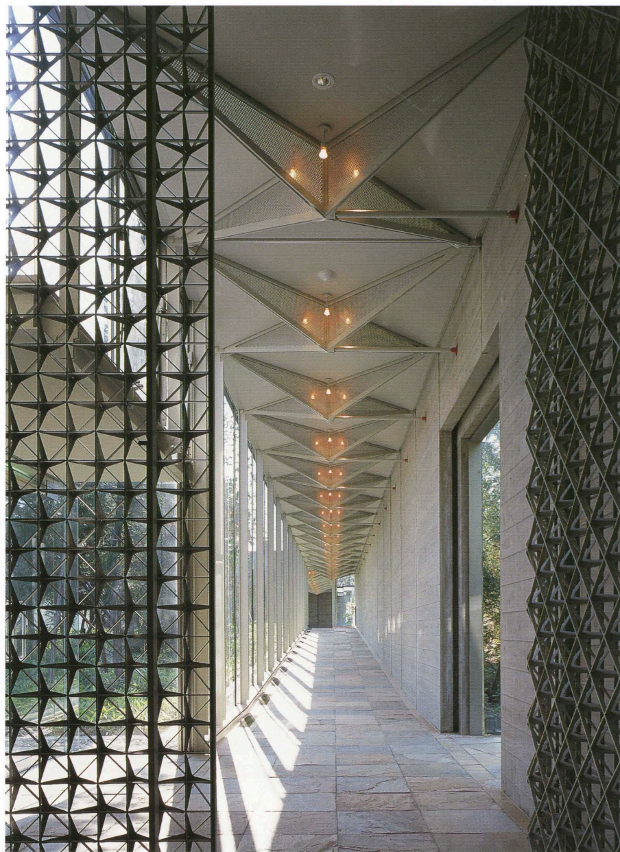
常設展示室-IIと企画展示室をつなぐ廊下 Corridor connecting the permanent exhibition gallery-II to the periodical exhibition gallery.