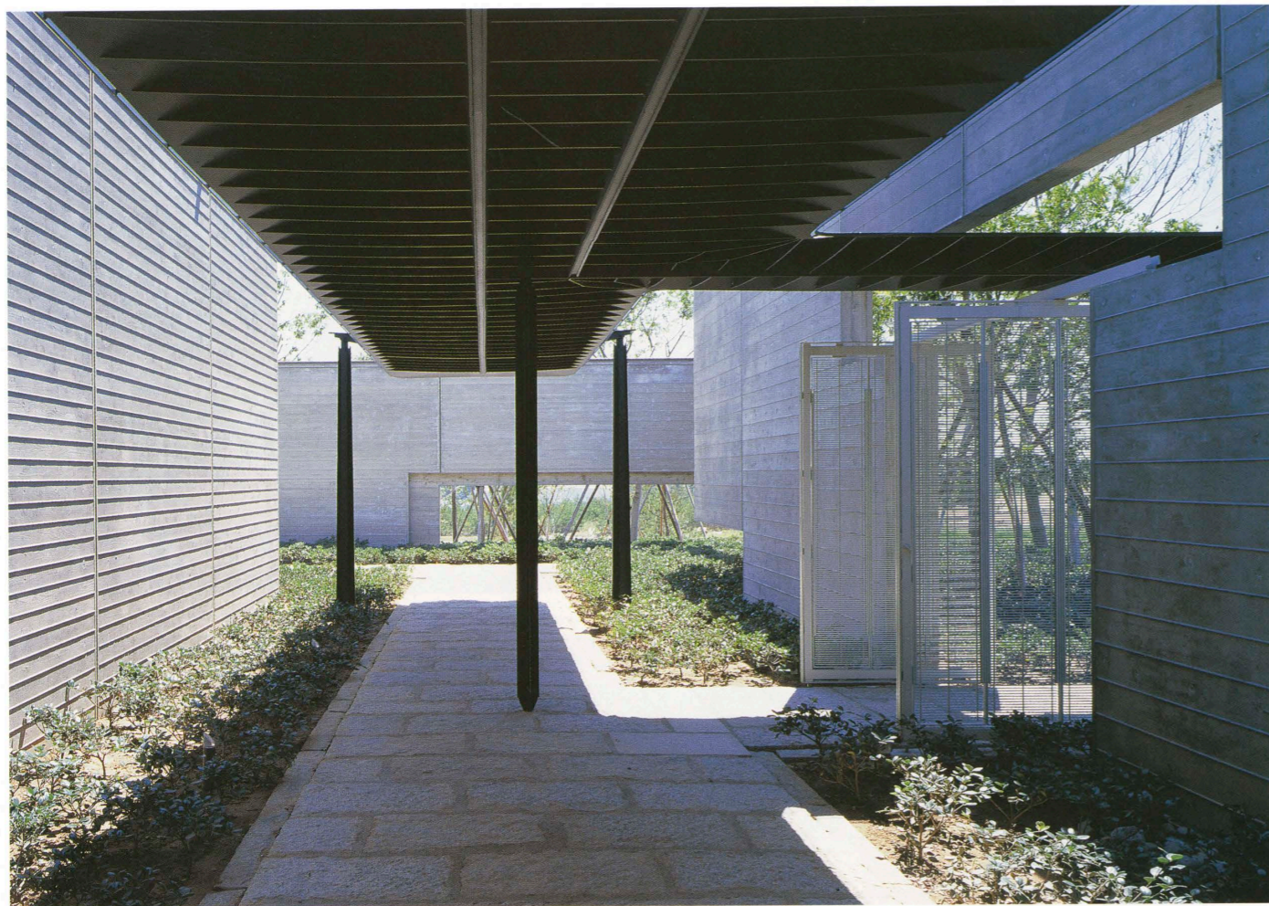
エントランス前のキャノピー Canopied porch seen from the entrance.