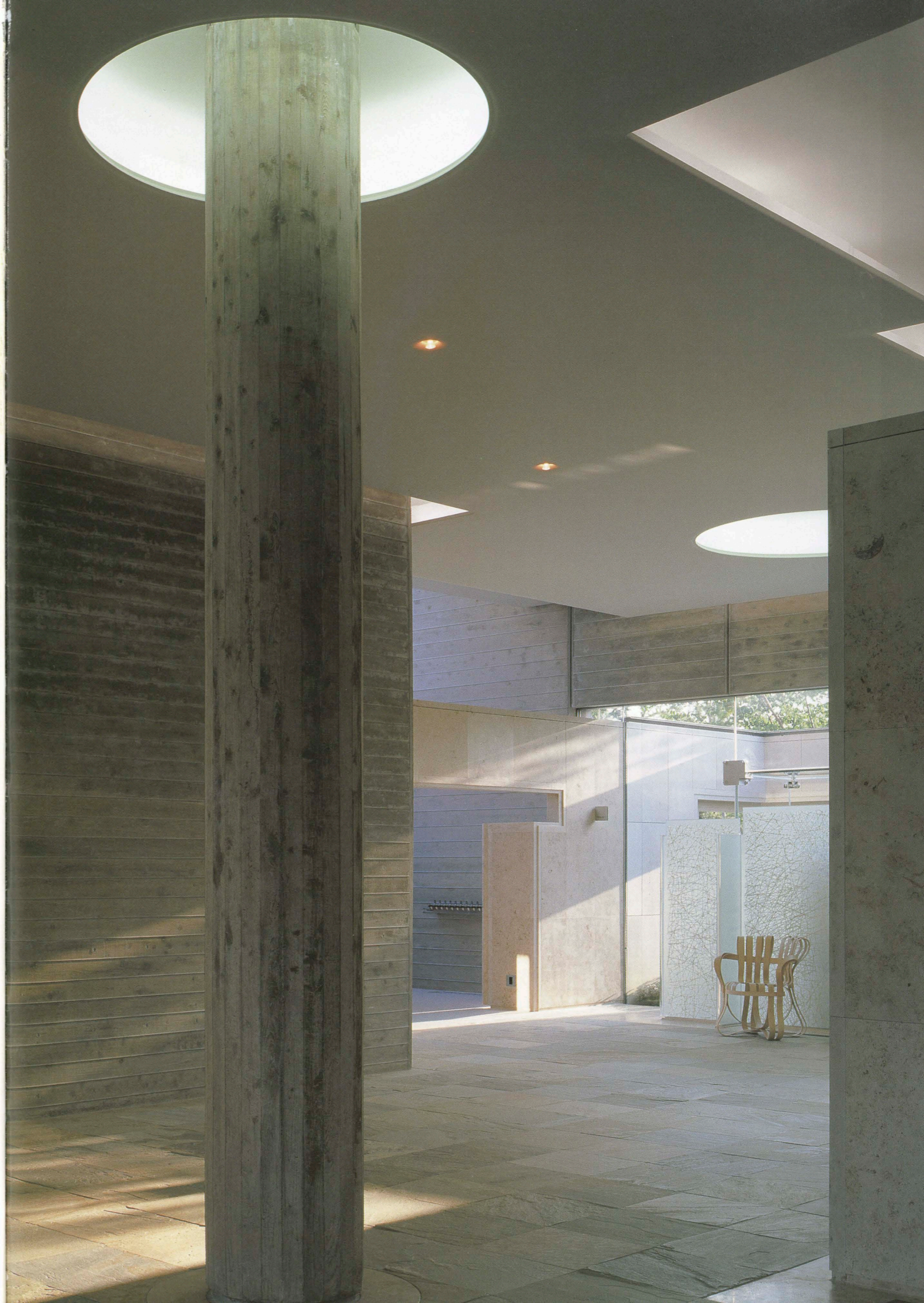
右頁：エントランスホールを見返す facing page: Entrance hall seen from the lobby.