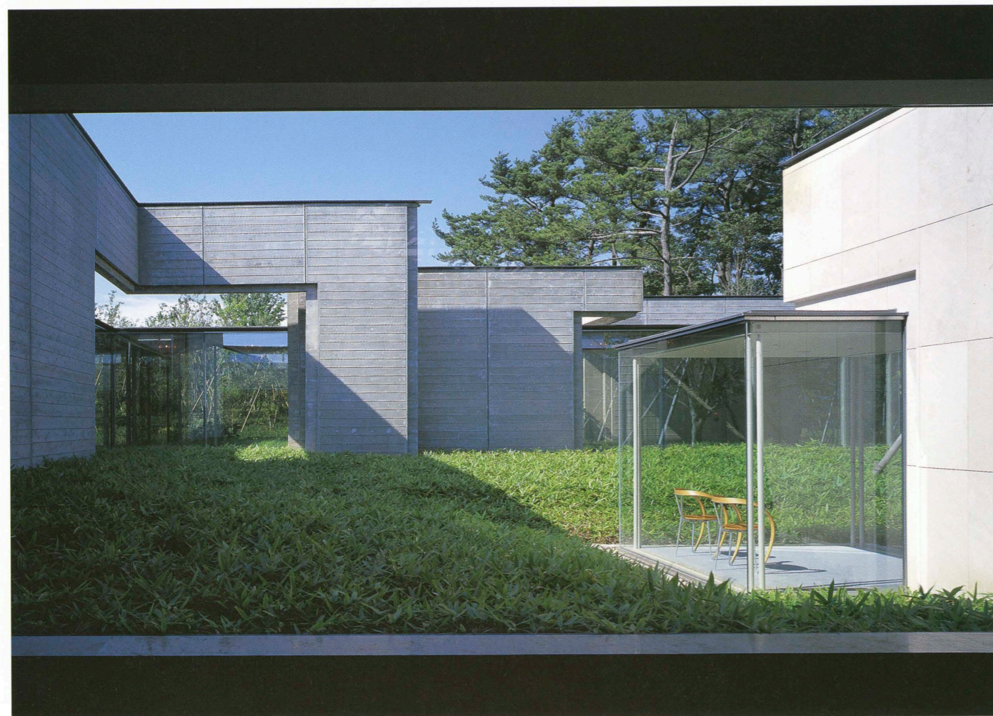
展示ホールから中庭を見る Courtyard seen from the exhibition hall.