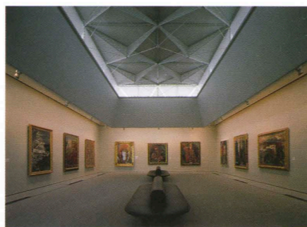
常設展示室-II Permanent exhibition gallery-II.