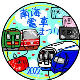
従業員がデザインしたヘッドマーク

また、10月7日（金）から10月29日（土）までの間、当社従業員がデザインした「電車まつりヘッドマーク」を、3編成の列車に掲出して運行します。なお、このヘッドマークデザインは、20名25作品から当社内コンテストで選ばれたものです。