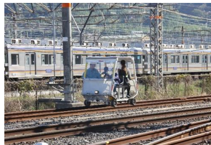
作業用軌道自転車試乗