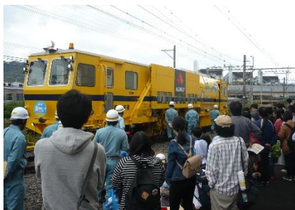
線路保守車両(マルタイ)展示