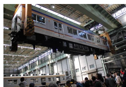
車両吊り下げ実演