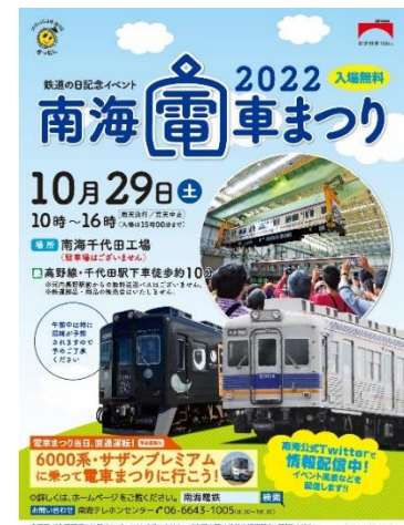
ポスターデザイン

南海電車まつり2022では、普段はなかなか見ること、体験することができない「子ども車掌体験（事前募集）」や「車両吊り下げ実演」「架線保守車（軌陸車）展示」など、各種イベントの開催や、「6000系車両（片道）」と「12000系車両（往復）」が難波駅～千代田工場間を臨時直通運転するツアーを実施します。