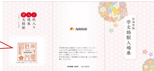
特製スタンプ押印イメージ