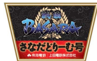
「天空」に掲出する記念ヘッドマーク