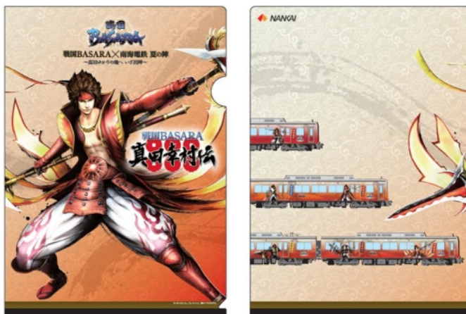
記念クリアファイル