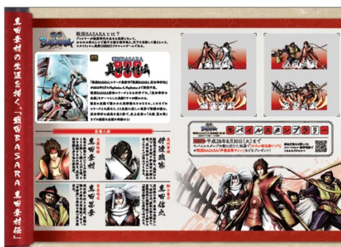
入場券の台紙（中面）