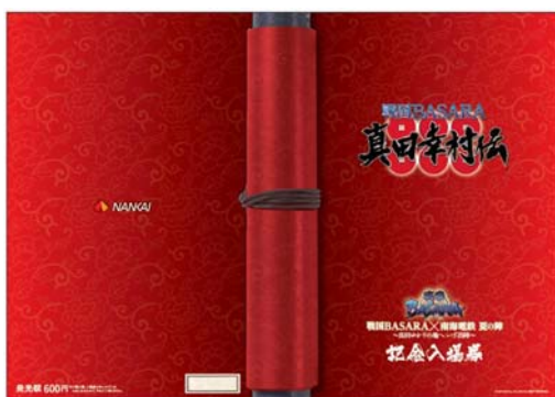
入場券の台紙（表面・裏面）