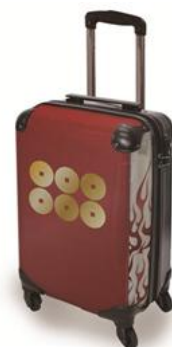
戦国BASARA仕様の「天空」座席指定券 参加賞の壁紙の一例（真田幸村） 戦国BASARAキャリーケース真田