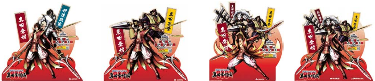
大型キャラクターパネル（左から難波駅、九度山駅、極楽橋駅／高野山駅<共通デザイン>、上田電鉄別所温泉駅）