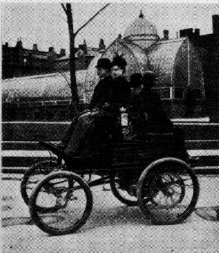
AN UP-TO-DATE VEHICLE MADE BY FISCHER EQUIPMENT COMPANY.

tion of both being effected by the manipulation of a single handle. A separate reversing switch is used which is provided with a lock, so that when the key is removed the vehicle cannot be operated by anyone not possessing a key. The various speeds are obtained by series paralleling the batteries, and in this work great pains have been taken to insure a uniformity of discharge from the batteries when in parallel, and contacts and connections of nearly four times the cross section ordinarily required are used, so that the resistance may be perfectly uniform.