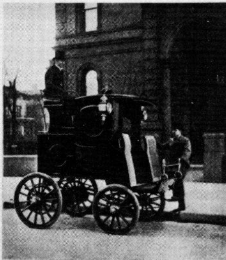
WOODS' VICTORIA HANSON CAB.

WOLFF'S English Bible, usually known as the Braumhall manuscript, from the Ashburnham collection, was sold at auction for $8,750, on May 1.