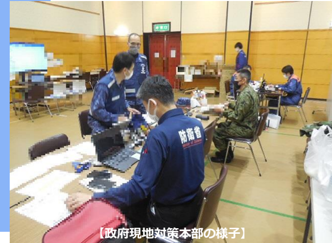
【政府現地対策本部の様子】