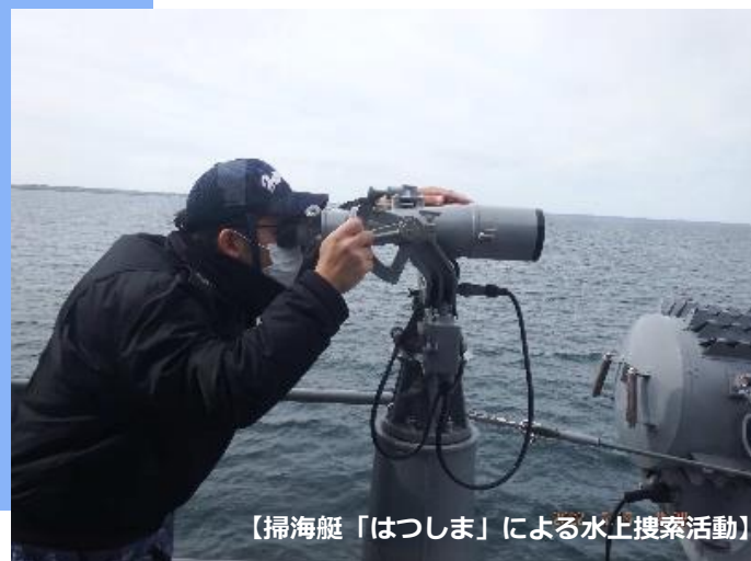
【掃海艇「はつしま」による水上捜索活動】