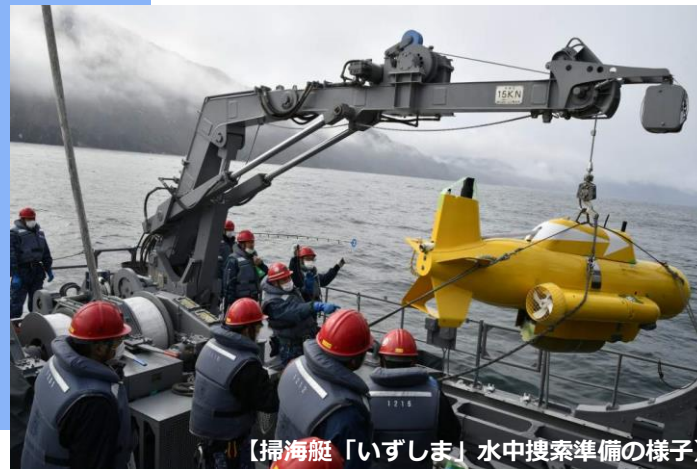
【掃海艇「いずしま」水中捜索準備の様子】