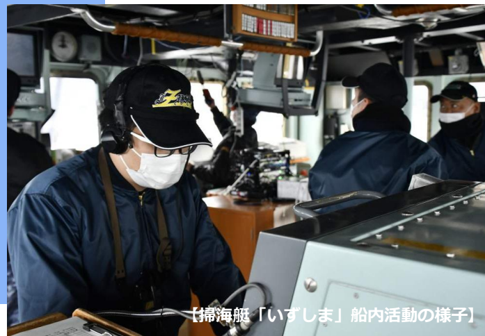
【掃海艇「いずしま」船内活動の様子】