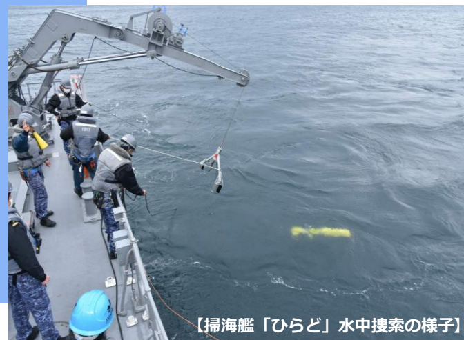
【掃海艦「ひらど」水中捜索の様子】