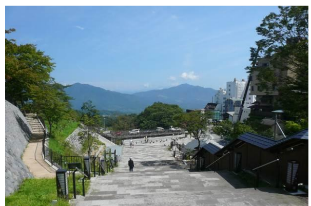
石段から北を眺めた写真である。北の山々がきれいに見える。