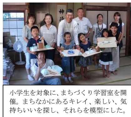
小学生を対象に、まちづくり学習室を開催。まちなかにあるキレイ、楽しい、気持ちいいを探し、それらを模型にした。

この活動は、「返子らしい景観は、市民の共通財産」との共通認識のもとに、歴史的背景と地域資源を活かした景観の向上を目指し、特に市街地の住環境を中心としたまちなみに焦点を絞り、景観まちづくり読本「まちなみデザイン返子」を作成したものである。冊子化にあたっては、地域ワークショップや子ども学習、美化活動の取材、モデル事業などの様々な活動を通して、魅力的で実効性のあるものを目指すと共に、より多くの住民に返子の景観について触れてもらい、市民参加のハードルを下げ、まちづくりへの関心を高めることを心掛けている。市民と行政が協働で様々な活動を行いながら丁寧に作ってきた経緯もあり、誰にでも読みやすい本になっている。また、フェイスブックでタイムリーに情報発信してきたこともあり、口コミで伝わり、返子市民のみならず市内外から大きな反響を得ている。