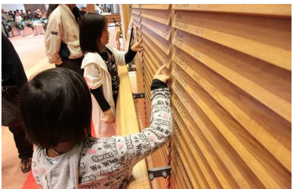
旭川駅：内装壁に地場の木材を用いて、1万人の名前を刻んだ。