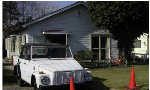
約 60 年前に建てられた米軍ハウス、この地区には当時の米軍ハウスが 24 軒残っており、全てが改修・保全され、使われている。この棟は写真スタジオとして使われており、改修に 1 年以上かけられた。