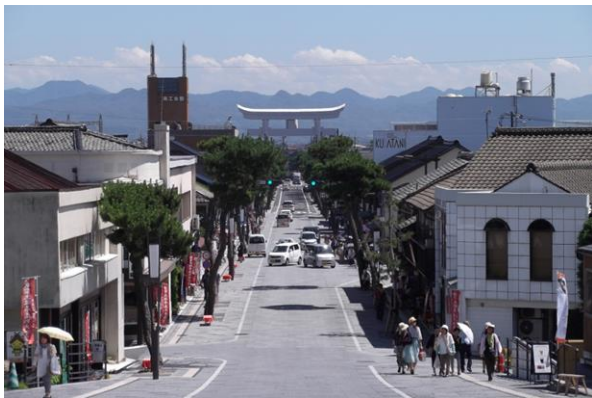
出雲大社勢溜りより南方の神門通りを望む。約100年前に開設にされた通りは、大鳥居と松並木が今も変わらず通りを象徴する景観となっており、石畳化と電線類地中化が通りの松並木を一層際立たせている。

受賞対象は出雲大社参道のリニューアルである。これまでも歴みち事業などで神社参道を高品質に作り替える整備は各所で行われてきており、そういった前例などとの比較も今回の審査では気になるところであった。インジェクション工法と呼ばれる自然石の舗装仕上げの質は高くフラットな路面に仕上がっている。照明灯他立ち上がっているもののデザインも洗練されている。とこれらは見た目であるが、この事業の意味はその準備段階にあると言ってよい。徹底したシェアドスペースの考え方により歩道の幅員を広く確保し車道との仕切りは白い石で引かれたラインのみである。段差もなければボラードもない。ワークショップで徹底的に議論し実現させたとのことであるが、交通管理者との協議など通常はなかなか難しいものである。もう一つはそうやって確保した歩行者空間の使い方であり、特区制度を活用して、「置き座」と呼ばれる縁台などが路上に出され、観光客の休息の場と通りの賑わいが提供されている。実はこの参道、明治期に鉄道駅が作られたことによりできた参道であり沿道は歴史的な町並みという点ではさほど意味深くはない。沿道建物のコントロールの強制力は必ずしも強くはなく、沿道が道路に対応していくには今少し時間が必要との印象であった。（高見）