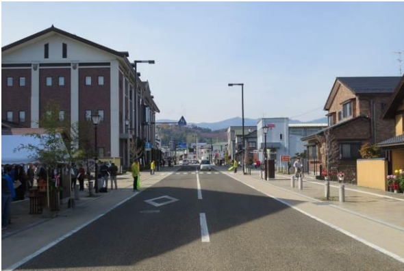
竹根通りを、西から東方向に見る。お城山の緑と、遠くには安達太良山が見える。

とにかく空が広い、道路の両端が山あて、しかも安達太良山と二本松城址、これこそが「ほんとの空とお城山が美しく見える景観づくり協定」という名前の元であることがよくわかる、気持ちの良い道路景観である。全国の多くの道路をみてきたが沿道の建築物の意匠より、何より大事にされてきた空が広いことが、居心地の良さに通じることが印象的であった。また、住民、市、県、そして学識経験者と建築士会、それらの非常に緊密なコラボレーションで、平成 9 年より長きにわたりまちづくりを作り上げてきた絆を強く感じる。また、110 回にわたるデザイン協議にも敬服する。さらには、道路を拡張したことにより、従来奥にあった蔵が沿道に露出し、展示スペースにしたり、居酒屋にしたり、新たな街のランドマークとして使い、地域の活力を生み出している。道路の拡張は、ともすれば、街の活気を失いがちであるが、この地区では、見事に、拡張による洗練された澄み切った空気を感じる街並みが息子世代への牽引に役に立ちそうな気配を感じさせられる、優秀賞に値する景観である。今後の継続にも期待したい。(池邊)