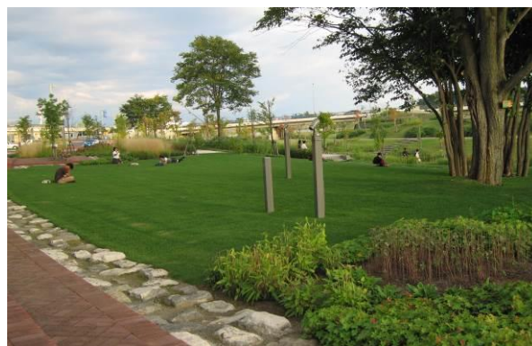
駅前側の広場：北側の喧騒とは異なり河川空間に隣接した憩いの広場。