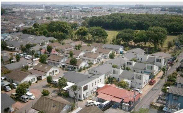
当地区は、西武池袋線の入間市駅から徒歩 18 分、当時の米軍のゲートの前に位置する。奥の公園は地区の南側の富士見公園。かつての農地解放で接収された土地である。

本地区は、戦后进駐軍の住宅を建設し賃貸運営してきた民間会社が、その後の荒廃・スラム化した困難な状態を克服し、「進駐軍ハウス」という文化遺産を改修・保全して、文化的で魅力溢れる住宅地の景観を生み出した価値ある事例である。留学先の米国でコミュニティを大切に作る住宅地づくりを学んだ建築家との出会いから、夢のあるこの事業が実現した。ここには戦前に同会社が建設した陸軍将校用の日本家屋も数多くあった。その一部を現代的なセンスで再生・活用する一方で、老朽化した大半の家屋を取り壊し、進駐軍ハウスの遺伝子を継承しつつ、内部の機能アップを果たした「平成ハウス」を設計・建設し、景観上の一体感がある日本離れした洒落た住宅地の町並みを創り出した。進駐軍ハウスは、内部のトラスを残しつつ、現代的な空間にリノベーションされる。アメリカ風の自由で文化的な雰囲気惹かれた家族が集まり、独特のコミュニティが生まれている。戸建て住宅の間に柵がなく、路地の外部空間は交流の場や子供の遊び場となる。大規模開発による街づくりとは対極にある、このような土地と建物の記憶を大切にしたい小規模で顔の見える景観づくりの努力を高く評価したい。（陣内）