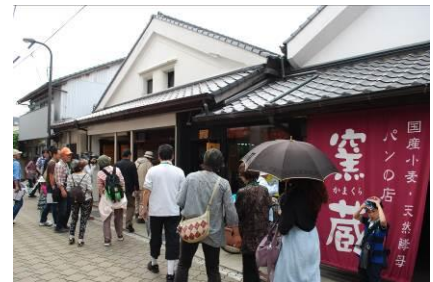
寺社、町家、路地等を巡る「景観歴史発掘ガイドツアー」の様子

このような状況の中で、当協議会を設立し、1st ステージでは、まち歩きマップや瓦版の発行、景観歴史発掘ガイドツアーや歴史的建造物での講演会・コンサート等の町並みイベント、2nd ステージでは、景観づくり計画の策定、町家の保存・再生活動、3rd ステージでは、景観づくりの手引きを活用した普及活動に取り組むなど、『姪浜の宝を福岡市民の宝に！』を目標に、景観まちづくりの各段階に対応した多彩な活動を、地域住民、関係団体、九州大学、行政等と協働で進めている。この様な継続的な活動により、徐々に地域の身近な景観資源を活かしたまちづくりが目に見える形で展開しはじめている。