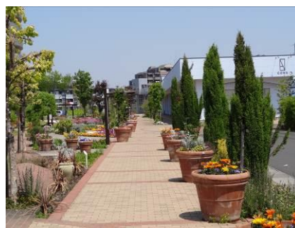
公園と住宅地の間に位置するテラコッタ花壇は公園に訪れた人の憩いの場に寄り添っている。

当地区は JR 高崎線北鴻巣駅西口駅前の土地区画整理事業により新しく生まれたまちである。公園、集会施設、まちなみという、「美しいまち」も日々その美しいまちを維持管理しなければ、当然劣化してしまう。劣化すれば、「資産価値の低下」を招くことになり、まちの魅力も薄れ、衰退へと向かってしまう。そこで、資産価値の低下を防ぐためにエリアマネジメントを導入し、安心・安全なまちの環境整備に努めてきた。平成 20 年には、特定非営利活動法人 (NPO 法人) を設立、まちなみ景観の維持管理・運営を通して、持続可能なまちづくり、まちなみ環境の保全・地域の安全等を促し、地域全体の永続的な発展を図る事を目的として、「自分たちのまちを自分たち自身でつくり育てていく」取組を実践した。具体的には、建築・外構ガイドラインの指標 (数値基準) をつくり、まちのパブリックエリアから、住居建築時にガイドライン審査を行い、ヒートアイランド現象の抑止や景観の統一を考慮したまちづくりを展開している。