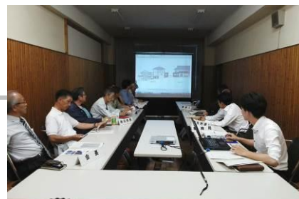
足助町並み景観相談会での地域住民、民間企業及び行政機関からの相談対応の様子。

当地区は、周囲の山並みと川に代表される自然景観と江戸末期から昭和初期の家が混在した歴史を感じさせる町並みから構成されている。足助まちづくり推進協議会では、この2つの特徴が調和した足助らしさの景観づくり推進のための景観ルールを作成や運用または行政機関との調整を主体に活動を行っている。景観制度の活用には、土地の利用状況や景観の特徴によりゾーン分けされ、各ゾーンの特徴に応じた基準を設けている(地域住民主体で作成した足助ルール)。その内容は景観保全と生活との調和の観点が組み込まれていることから、運用は地域の住民代表等で構成される足助町並み景観相談会が行っている。この足助町並み景観相談会では、地域住民、民間企業及び行政機関からの相談を取り扱っており、年間100数件の案件に対応する足助の景観保全における軸となっている。また、足助地区では平成25年度に都市再生整備計画事業等の行政によるハード整備(無電柱化や道路修景、橋梁修景)が行われたが、その内容は、足助景観ルールに沿って実施されており、地域住民による景観保全への思いが着実に具現化してきているという。