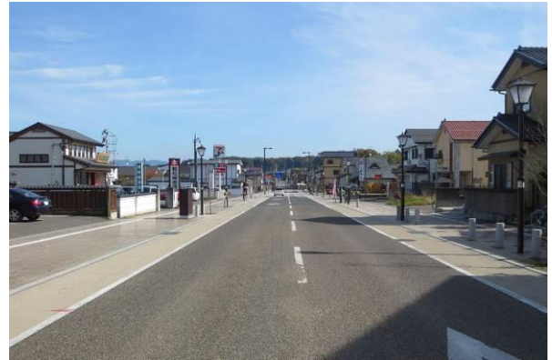
竹根通りを西から東に見る。電線地中化により、白猪山手前の森が背景として綺麗に見える。