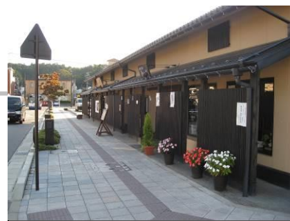
和風の外観(格子、庇、色彩、緑化など)を意識して新築された建物。

こうした中、平成20年から石川県及び七尾市が着手した環境整備に合わせ、地域住民として、和倉温泉らしく格式と温泉情緒ある雰囲気創出と、質の高い観光や居住の環境形成を図ることを目的として運営委員会を発足した。住民に対する説明を重ね、合意形成に大変苦慮しつつも、約6年をかけ平成26年3月に北陸で初となる景観法に基づく景観協定を締結し、同年4月より協定の運営を開始することができた。運営を開始したばかりであるが、今後も景観法に基づく景観づくりを推進し、地域景観への意識醸成と観光客増加に繋げていきたい。