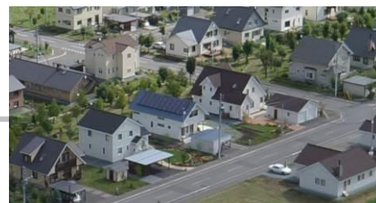
建築緑化協定に基づくまちなみ。三角屋根を基調とし、全体の統一感を創出。

東川町では環境保全と景観形成を一体的に取り組むため「美しい東川の風景を守り育てる条例」(平成14年)を制定し、平成18年に景観計画を策定した。東川町土地開発公社が開発する「グリーンヴィレッジ・東川」では、分譲時に町と公社と所有者との契約として建築緑化協定を締結し、景観計画に基づく景観形成基準への準拠と創出された敷地内の緑の適切な管理を決めている。第1期分譲の協定は景観法83条にもとづく認可(条例規則で手続き規定)後、法定協定となるとしているが、協定の主旨は法定化による拘束力の強化ではなく、町と公社と住民がそれぞれに役割を担い、東川らしい住宅地のまちなみ形成と、住まいの緑と公共の緑地を一体的に管理活用する取り組みを進め行くための契約と考えられている。景観への取り組みや協定運営委員会による緑の管理が着実に進められていることで、住宅地の評価は高い。現在分譲中の第3期の協定では法定協定の規定はなくても問題ないところまで、住民と町との協働による景観まちづくりが定着してきた。法定の景観協定化を可能とする「建築緑化協定」により剪定や環境管理の役割分担を試行しながら望ましい協働のあり方を見出している取り組みを評価したい。(小浦)