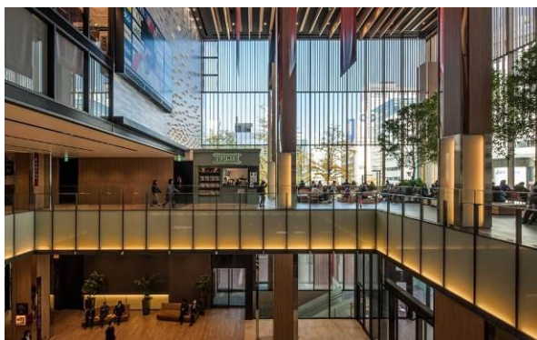
建物内に取り込まれた地下歩行空間への道路区域(写真右下の階段)はアトリウムに面し明るく開放的な設えとなっている。