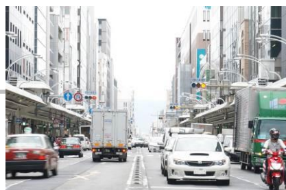
新景観政策により規制強化した屋外広告物等に関する条例の経過措置期間が終了した平成 26 年 9 月時点における当地区を代表する繁華街である四条通の広告景観

こうした魅力ある景観を創出する取組は、国内外から評価を得ており、市を訪れる観光客数も増加傾向にある。