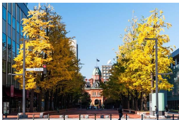
土木遺産のイチョウ並木と赤れんが庁舎への象徴的なビスタ。