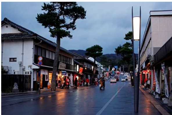
通りに植えられた松にちなみ松の葉をイメージさせる街路灯と、電線共同溝整備による架空線撤去によって開放感溢れる空間となった神門通りの夕暮れ。