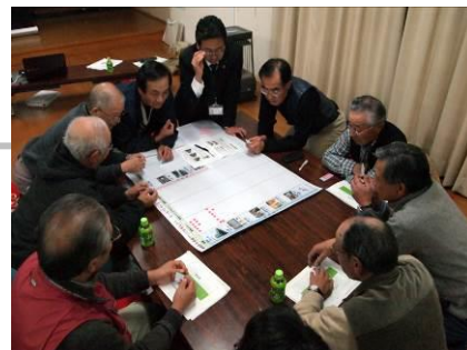
第3回景観づくり勉強会(水主町の住民)の様子。

以上のように、東日本大震災の被災後にありながらも、住民や行政の景観に対する高い意識を持って進められ、景観法等の制度を活用した独自の取り組みは、都市景観大賞に相応しい活動として高く評価された。(出口)