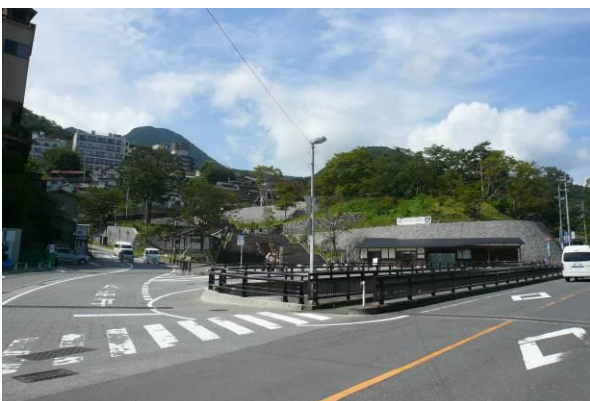
当地区を主要地方道渋川松井田線から見た写真。中央が石段。

今後は、石段街上部の沿道建物の景観整備や広告物整理をさらに進め、回遊性のある散歩道と眺望景観が同時に楽しめる魅力を高めて欲しい。伊香保の急勾配のこの石段街は、国内はもちろん世界にも誇れる魅力ある景観になる要素があり、今後の展開をおおいに期待をしている。（卯月）