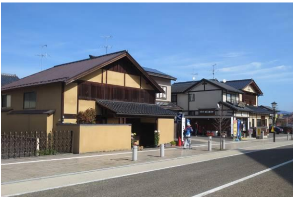
景観協定にもとづくデザイン協議を経て完成した建物。町家風。