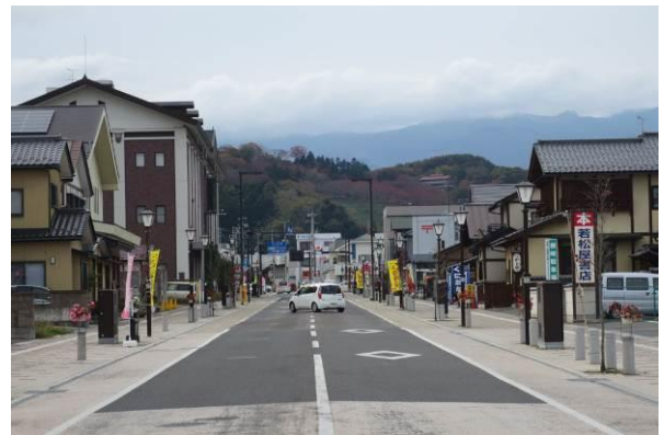
街路デザインは、駐車帯の色を歩道と合わせて車道を狭く見せ、横断歩道部分もイメージハンブにした。