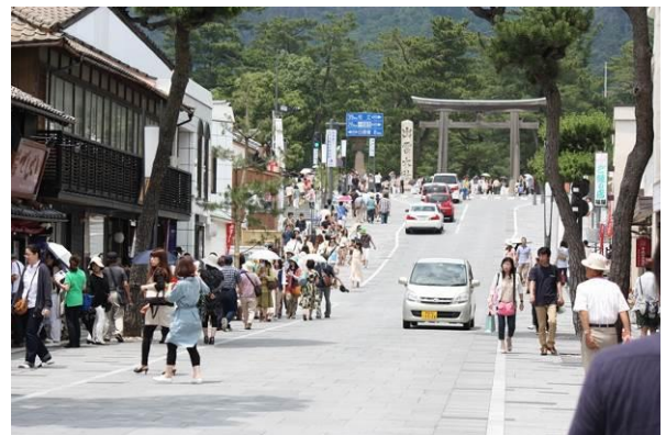
賑わいを見せる神門通り