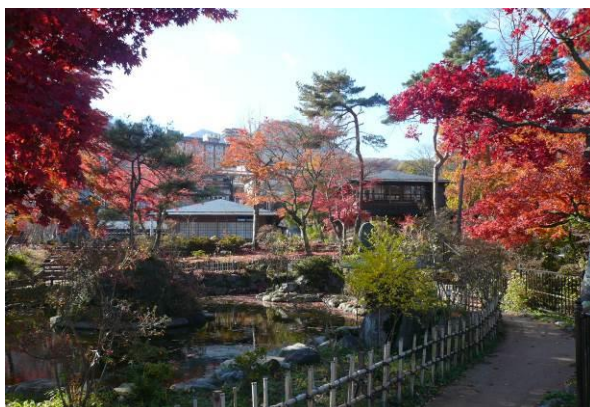
上の写真の右上に広がるエリアである。池の周りや奥に見える建物（ハワイ王国公使別邸）などを整備した。（紅葉の時期）