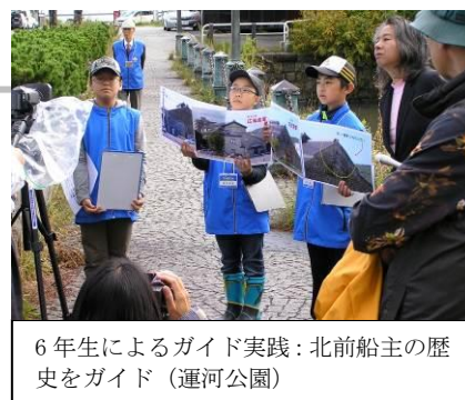
6年生によるガイド実践:北前船主の歴史をガイド(運河公園)

この活動は、小樽市立色内小学校 5,6年生を対象に小樽観光大学校(観光人材育成のために産学官で構成された民間の任意団体)の検定試験「おたる案内人」の資格を取得した観光ガイド(「おたる案内人」)が、小樽の歴史を伝え、さらに6年生の最終課題として観光ガイドを実践させることである。一般市民である「おたる案内人」が指導役となることは、生活者としての視点も踏まえ授業を進めることができる他、資格を取得した市民が市民へ地元の歴史を伝えていくという循環型の独自の仕組みとなっている。また「おたる案内人」公式テキストブックをもとに、ジュニア用テキストを制作する等、独自のアイディアが盛り込まれている事も特徴である。