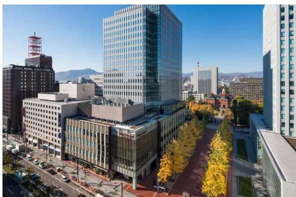
当地区は、札幌の都市づくりの起点である赤れんが庁舎の前面に位置している。

生活やビジネスシーンを支える大動脈として1日7万人の利用がある札幌駅前通地下歩行空間のほぼ中間に位置する当地区は、新たな都市の回遊性を生む拠点として重要な役割を担っている。道庁から延びる北3条通は歴史、文化の香り高い「うけつぎの軸」として将来が期待され、その起点となる広場 AKAPLA は2つの建物内の公に供する空間とともに街づくりの要である。特筆すべき点は赤れんが庁舎と連携した景観形成と精緻なデザインによる継承と創造である。広場と建物外構には同じ道産のレンガを用いることで空間に一体感を与え、自然のうつろいの中で1年を通して札幌らしい魅力的な都市の風景が創出されている。建物内のアトリウム、貫通通路、眺望ギャラリーなどは市民や観光客が快適に過ごすことができる空間として利用度が高く、地下に移りがちな北の都市生活を地上に引き上げるきっかけとなっている。街を眺めるウィンターガーデンの設え、地下歩道との接合部の扱い、広場の装置類はデザイン的に秀逸で人々が集う場に大きく貢献している。まちづくり会社によるエリアマネジメントの活動もクオリティが高く、当地区の活性化に大きな力となっているようだ。過去の実証実験や先行するチカホでの実績もあって当地区の賑わい促進に多方面から期待が寄せられている。このように歴史を礎とした場の価値創造・デザイン性の高い空間形成・活性化のための手厚い運営が官民の連係で一体的に進められていることが評価につながった。(富田)