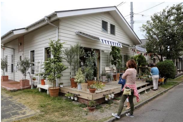
屋根の構造を 2×4 構造とし、屋根裏部屋に住むことができ、床暖房がある「平成ハウス」。米軍ハウスの小屋組みはトラス構造であったため、屋根裏に部屋をつくることができなかった。屋根裏部屋に住んで店を持つことができ、借家であるが、内装を自由にしてもよいとしている。