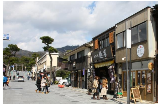
沿道建築物修景事業により、徐々に統一感ある街並みが形成されつつある通り。街路整備に端を発して、新規出店が相次いでおり、通りは観光客であふれかえり、賑わいが復活している。