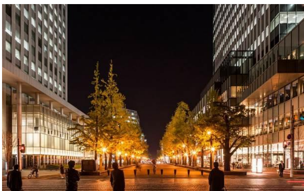
夜景の札幌北3条広場と広場からセットバックする開発ビル(札幌三井 JP ビルディング：写真右側)