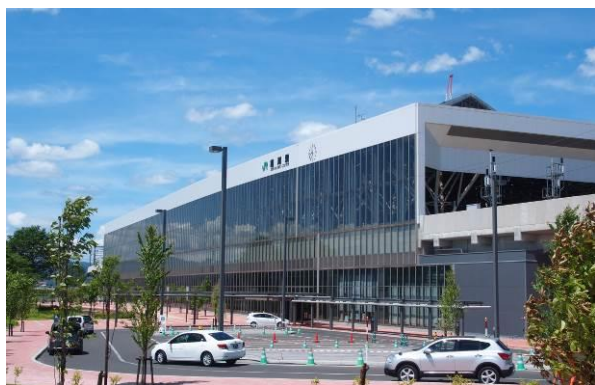
旭川駅：外観を南側の駅前広場より臨む。

平成 2 年に計画検討が開始されてから、実に四半世紀の時を経て、素晴らしい街が姿を現しつつある。その風景は当初描かれたスケッチそのままに、川と自然と街が見事に融合したものとなっている。計画実施以前は、鉄道によって既存市街地と完全に分断され、それ故に豊かな河川環境も保たれていた。そこに、自然を活かした土地区画整理と河川空間整備を行い、広がりのある河川公園とシビックコアが生まれた。鉄道高架によって、街との繋がりを生み出し、他に類を見ない素晴らしい駅舎が生まれた。さらに、三本の橋梁を建設することにより街の連続性をつくり、都市発展の基盤としている。これらの一連の計画の素晴らしさは、全ての事業を連携させる「まちづくり推進会議」を設置し、粘り強く、一つ一つの価値を繋ぎ、高めていったことである。そこには、想像を絶する苦労があったに違いない。改めて、関係各位の長年の努力に敬意を表したい。現在、街はまだ発展途上であり、そこに立ち上がった個々の要素も全てが完璧とは言えないかもしれない。しかし、この素晴らしい基盤があるからこそ、より良い未来が生まれるに違いない。「北彩都あさひかわ」の更なる発展に期待したい。(田中)