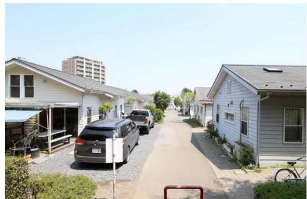
街路の左が新築の平成ハウスの町並み、右が米軍ハウスの町並み、右手前がセキスイハイムの 2 階建ての 2 階部分を撤去し、外装内装を改修し、米軍ハウス風に作り替えた棟。いずれも白で統一され、屋根の傾斜も合わせてある。