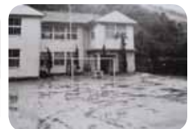
当時の校舎と校庭