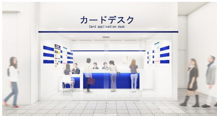
<カードデスク パース画像>