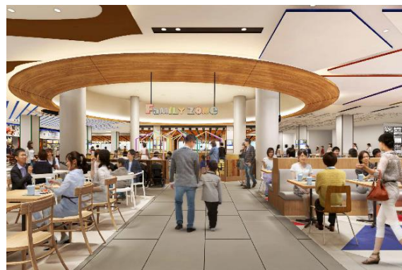
<「FAMILY ZONE」 パース画像>