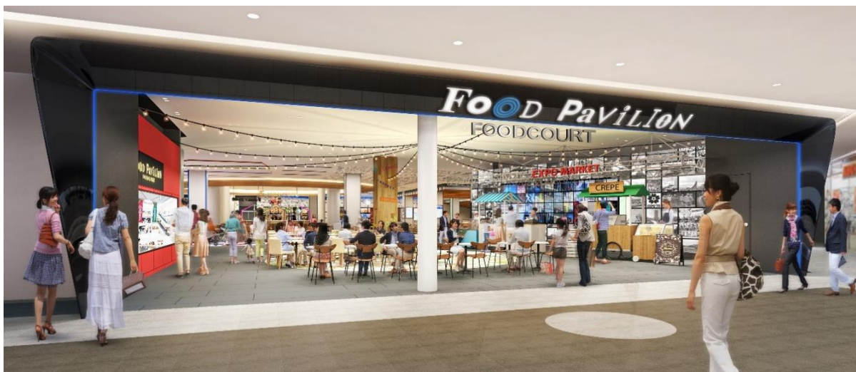
<3階フードコート「FoOD PaVilIoN(フードパビリオン)」正面入口 パース画像>

また、当社グループ共通の感染対策基準として策定した「三井不動産9BOX 感染対策基準」(※添付資料⑤参照)に基づき、十分な換気性能を確保し、ご利用者の皆さまにゆつくりとお過ごしいただける安全・安心な環境を提供してまいります。