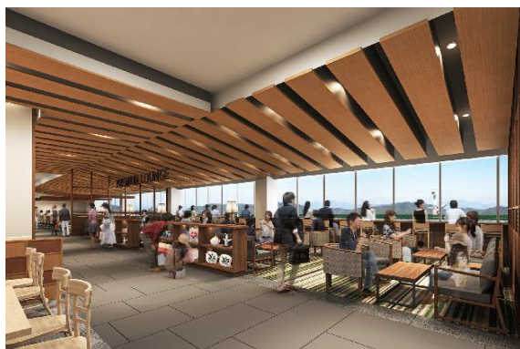
<「LA LA LOUNGE」・「PREMIUM LOUNGE」 パース画像>