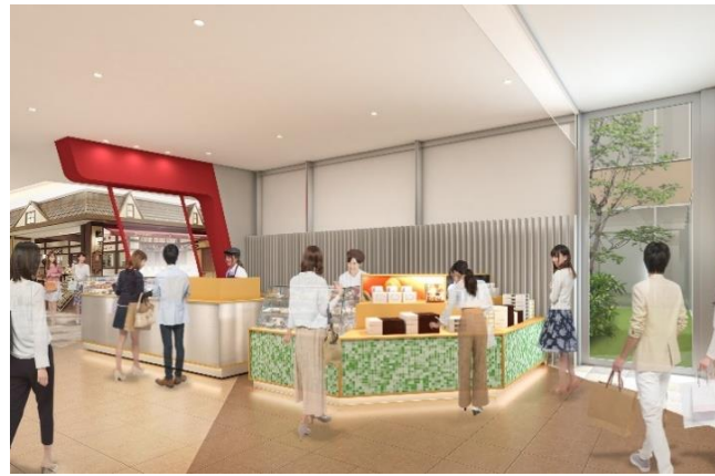
<イベントスペース パース画像>

観覧車・EXPO KITCHEN から続く本館入口付近(オレンジサイド 1 階)にイベントスペースを新設いたします。話題のスイーツやフード・人気の雑貨アイテムなどの期間限定ポップアップショップを展開し、ご来館いただくお客さまに折々の旬の魅力をお届けします。