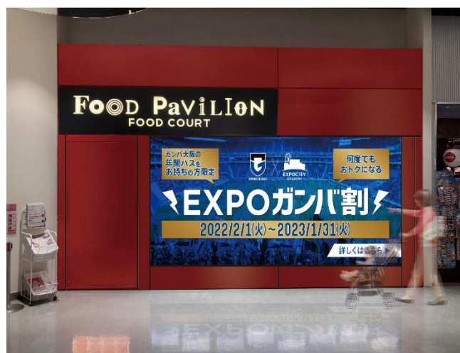
<フードコート内大型デジタルサイネージ イメージ>