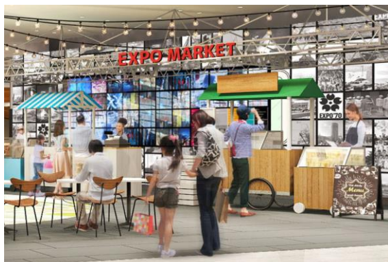
<「EXPO MARKET」 パース画像>