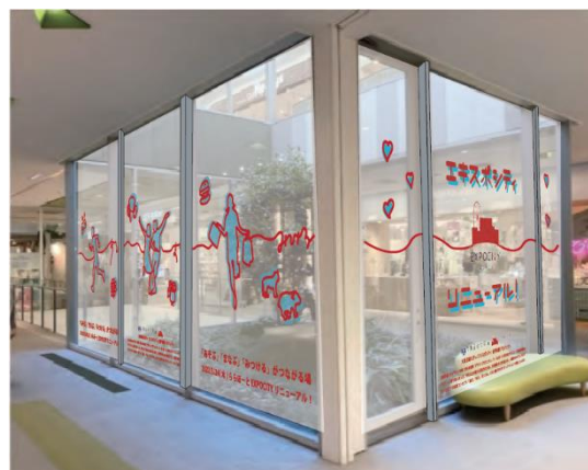
<リニューアル館内装飾 イメージ>

大阪芸術大学は、建学の精神にもとづき、芸術における狭義の創造性ととどまらず、科学技術・産業・交通・通信・政治・行政その他社会活動全般にわたり創造性を奨励し、柔軟に広義の創造性を発揮できる人材の育成に力を入れている教育機関です。当社が管理・運営する関西エリアの商業施設において、大阪芸術大学の学生の創造力やアイデアを生かし、幅広い分野で協同し、ともに地域の発展および活性化を図っています。