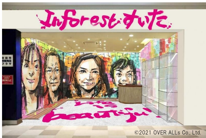
<inforest すいた リニューアル後店舗 イメージ>

多数のメディアにも出演実績のある株式会社 OVER ALLs(所在:東京都世田谷区、代表:赤澤岳人)による内装アートが目を引く非日常的な空間から、当館を訪問いただく皆さまにこのまちの魅力を発信します。