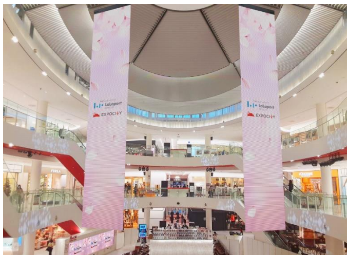
<「光の広場」大型デジタル懸垂幕 イメージ>

また、フードコート内大型デジタルサイネージでは、万博記念公園やガンバ大阪等の周辺エリア情報や産官学連携の取り組みを中心に紹介します。