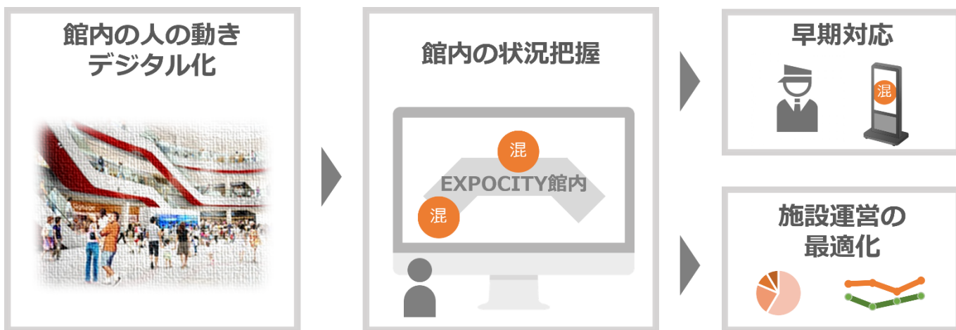
<「ひとなび」導入による施設運営イメージ図>

※「ひとなび」は、国立大学法人大阪大学の登録商標です。「ひとなび」のシステム開発・運用は、大阪大学発のベンチャー企業「HULIX」が提供しています。