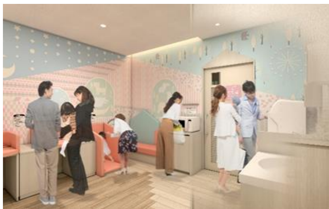
<ベビー休憩室 パース画像>

子育て世代のママ・パパの利便性・快適性を高めるよう、「ベビー休憩室」を改修します。お子さまにミルクを飲ませたり離乳食を食べさせたりしやすいよう、おむつ替えエリアにソファを設置しました。また、授乳個室のソファも従来より大きいサイズのものに変更し、内装も子ども部屋をイメージした空間に刷新しました。