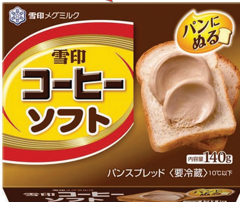
『雪印コーヒーソフト』140g