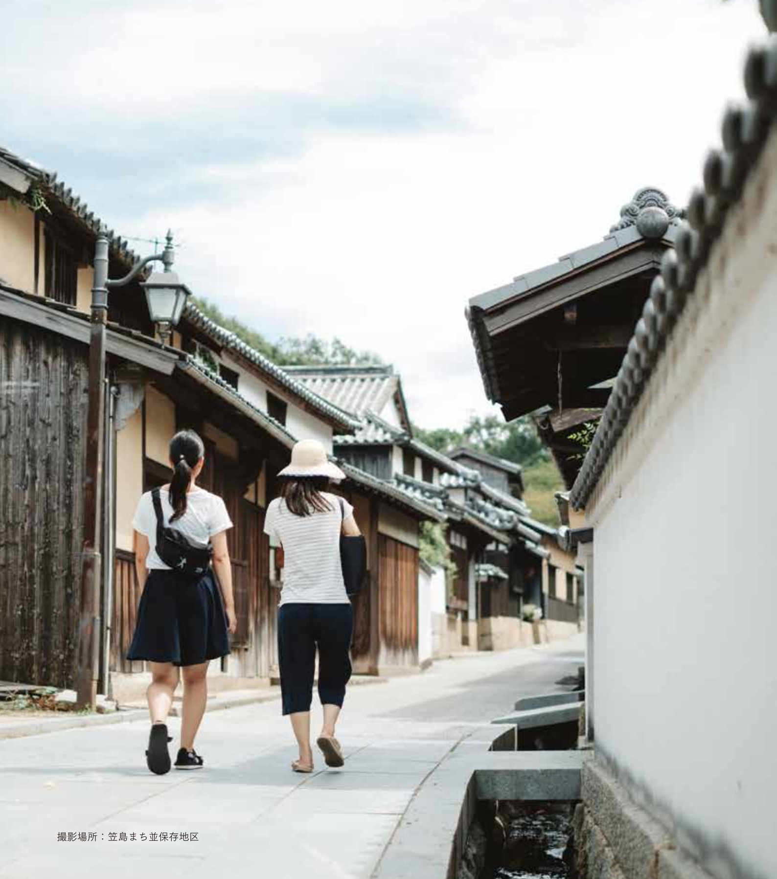
撮影場所：笠島まち並保存地区