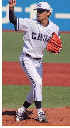
※デジタルメディア「4years.」より一部抜粋(スポーツライター:小川誠志氏)

第3週1回戦は天候不順により2日延び、「そこはちょっと調整が難しかった」と植田は言うが、立ち上がりは立正大打線につける隙を与えず、4回までパーフェクトピッチング。5回1死となったところでパーフェクトは途切れたが、しっかりと後続を断った。5回3分の1を投げ、被安打3、2失点、四死球0の内容。先発での初白星を手にした。