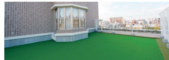
バッティング練習場 美しい眺めを見ながらバッティング