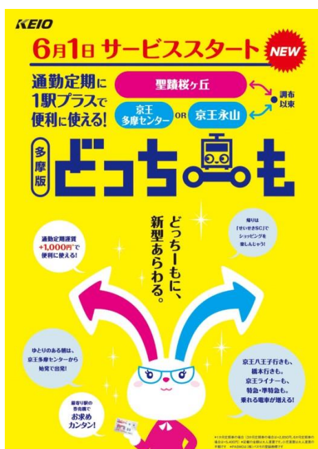
《多摩版どっちーも リーフレット（イメージ）》