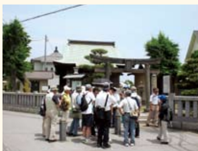
金沢歴史の道歩く「地元「金沢」の歴史を知らう—街歩きを楽しく—」