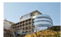
関東学院中学校高等学校新棟(2008年2月完成)