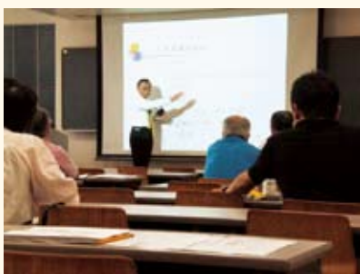
関東学院創立125周年記念講座『キリスト教とは何か—関東学院大学の建学の精神を学ぶ—』

春学期に開講して人気を博した『源氏物語の世界』、また学院創立125周年記念事業として僚業会協賛の『港都横浜の文化——市民と学ぶ横浜学』、建学の精神を学ぶ『キリスト教とは何か』等の講座にもご注目ください。語学の講座も初級コースだけでなく、中上級コースも引き続き開講します。『日本の文化——美しき能の世界』は3回目、『ギリシア古典を読む』は2回目で、継続して学びを深めていける講座も多くあります。地域や企業との協力によるユニークな企画もあります。ぜひガイドブックをご覧ください。本学ならではの生涯学習のコースをお楽しみください。