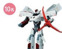
シンカリオン800つぼめ ©プロジェクトシンカリオン JR九州承認済