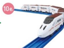
プラレール新800つぼめ JR九州承認済