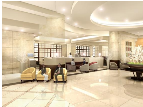
<「ザ ロビーラウンジ」イメージ>

また、1 階のカフェについては、隣接するロビーとの一体感のある開放的な空間とし、店名を新たに「ザ ロビーラウンジ」として、4 月 26 日（木）にリニューアルオープンします。あわせて、増加するインバウンド観光客によるロビー内の混雑を緩和するため、ロビー空間の拡大と家具・什器の更新を実施します。