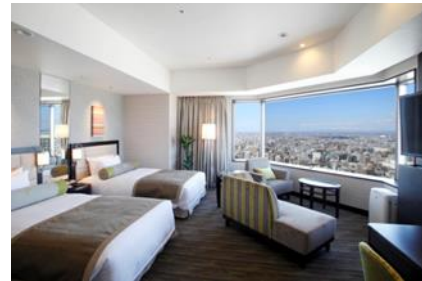
(コーナーデラックスツイン)